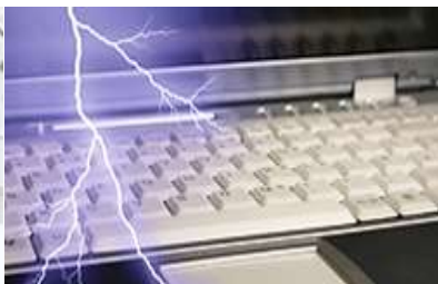
Lightning protection solutions