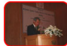
ヨシユツト科学技術大臣