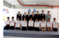
奨学金受給学生代表との記念写真