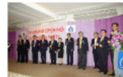
レセプションパーティー風景