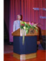
中川トヨタ自動車副会長