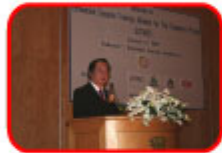
渡辺経済産業副大臣