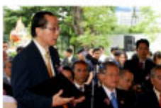
ブラウンTPA会長による報告