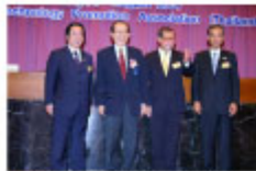
渡辺経済産業副大臣(左端)/ ブラウンTPA会長/小林大使(右端)

8月3日、TPA国際フォーラム“人材育成～タイの国際競争力強化・革新の鍵～”を開催いたしました。小林秀明 駐タイ日本国大使にご祝辞をいただいた他、日本から起こし頂いた渡辺博道 経済産業副大臣による基調講演ならびに中川勝弘 トヨタ自動車株式会社副会長による事例紹介など、日・タイの官民両機関による様々な人材開発のお話を頂戴いたしました。