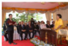
スポンサー理事長による報告