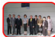
安倍前首相に揮毫いただいたTNI祝礼の前で