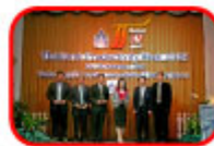
Best Practice OEE発表者