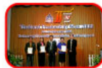
教育機関の5S発表者 (PTT学校の5S事業)から