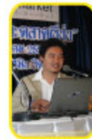
マコン氏 (タイ産業デザイナー協会会長)

セミナーには205名が参加し、終了時間を1時間過ぎても質問が止まらないほど熱気に包まれました。