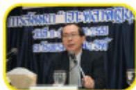
プラユーン会長による開会の辞