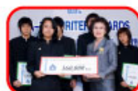
タイ国中央銀行総裁代理