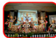
プレゼンテーション...