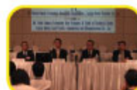
Toyota Motor Thailand様 による特別講演

5月24日(土)、パタナカーン新館において、2008年定時総会を開催いたしました。