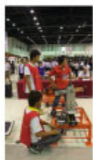
TPA Robo Pitch & Toss 2009

今年の各競技課題は、大学生大会が、今年のABU大会開催国日本の伝統的な乗り物「かご」による旅をイメージした競技「旅は道づれ 勝利の太鼓を打て」、PLC 競技はコイン投げゲーム形式の"TPA Robo Pitch & Toss 2009"(オートレース補助事業)。高校生ロボコン"TPA Robot Grand-prix Junior"では、囚われのお姫様を助け出す騎士競技「Robo Knight 2009」、体操競技「Robo Gymnastic 2009」と寸劇競技「タイ観光」の3競技で、2日間に渡り熱戦が繰り広げられました。