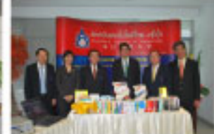
ご寄贈図書の前にて