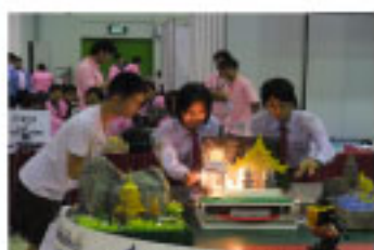
寸劇「みんなが好きなタイランド」