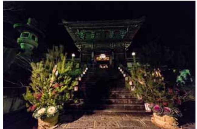
▲ คะโตะมะทซุสไตล์ดั้งเดิมประดับที่หน้าประตู Niomon สองด้านของวัด Hasedera