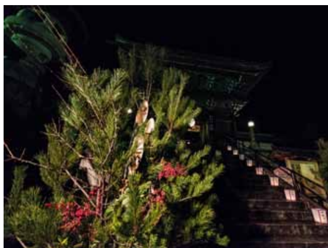
▲ คะโตะมะทซุขนาดใหญ่ที่ประดับหน้าวัด Hasedera ในนาราตั้งแต่วันที่ 31 ธันวาคมจนถึงราววันที่ 15 มกราคม

ประดับแล้วก็ต้องมีการปลดออกตามธรรมเนียมเช่นกัน โดยทั่วไปผู้คนจะปลดคะโตะมะทซุ และชิเมะนะวะคะชะริออกก่อนวันที่ 7 มกราคม แต่ในบางภูมิภาค เช่นคันไซ ถือธรรมเนียมปลดออกก่อนวันที่ 15 มกราคม ซึ่งเป็นวันที่ผู้คนจะนำเอาเครื่องประดับเหล่านี้ไปรวมกันเผาในพิธีศ"ตงโตะยะกิ" ที่ลานของศาลชินโตใกล้ๆ บ้าน และบางภูมิภาค เช่น