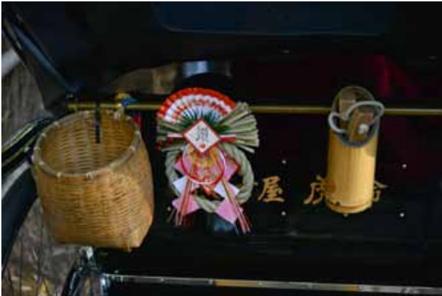
▲ ชิเมะนะวะคะชะริ หน้าตาจิ้มลิ้มติดอยู่ด้านหลังรถเข็นแถวป่าไผ่อาราชาธิยามะในเกียวโต