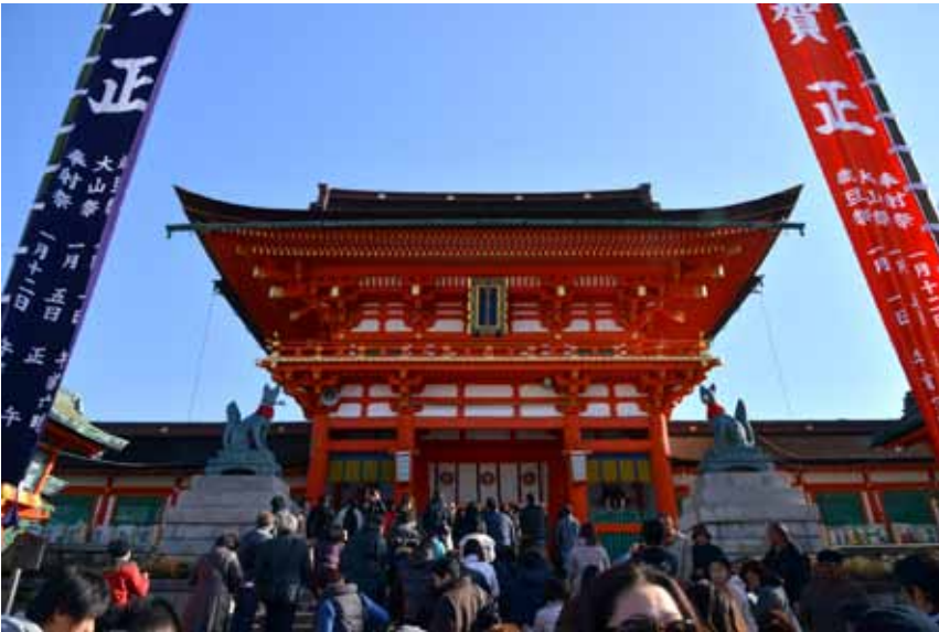
ผู้คนพากันต่อแถวเพื่อไปสักการะเทพเจ้าที่ศาล Fushimi Inari ทางตอนใต้ของเมืองเกียวโตในเทศกาลปีใหม่

ไม้ว เริ่มเข้าเดือนธันวาคมก็มักจะเห็นร้านดอกไม้ไปจนถึงซูเปอร์มาร์เก็ตเตรียมเอาเครื่องประดับปีใหม่ออกมาจัดหน้าร้าน และมาวางขายกันทั่วไป โดยทางภูมิภาคคันโตจะเริ่มเตรียมตัวกันตั้งแต่วันที่ 8 ธันวาคม เป็นต้นไป ในขณะที่ภูมิภาคคันไซยึดธรรมเนียมว่า จะเริ่มจากวันที่ 13 ธันวาคม ซ้ำกว่าทางคันโตเกือบหนึ่งสัปดาห์ อย่างไรก็ตาม หลังๆ มานี้ แม่บ้านจำนวนไม่น้อยที่ทำงานนอกบ้านหาเวลาไม่ค่อยได้ ส่วนใหญ่จึงมักเริ่มประดับปีใหม่อันช้า แต่ก็ไม่เกินวันที่ 28 โดยจะเลื่อนวันที่ 29 เพราะคำเรียกรวันดังกล่าวในภาษาญี่ปุ่นหรือ "นิจูกุ" จะไปซ้ำกับคำว่า "二重苦" หรือ "ลำบากซ้ำ" และก็ไม่นิยมประดับในวันที่ 31 เพราะเสมือนผักชีโรยหน้า "ประดับคืนเดียว" (อิจิชะคะชะริ) 「一夜飾り」 ตั้งงานศพ ถือว่าไม่เป็นมงคลทั้งคู่ วันที่ 30 ถือเป็นวันสุดท้ายของเดือนตามปฏิทินจันทรคติ ไม่นิยมประดับของมงคลเช่นกัน