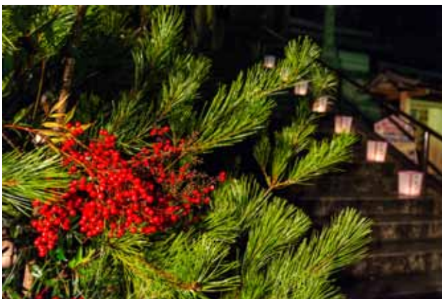
▲ สนเขียวสดกับลูกน้แดงที่หน้าวัด Hasedera ในค่ำวันที่ 31 ธันวาคม