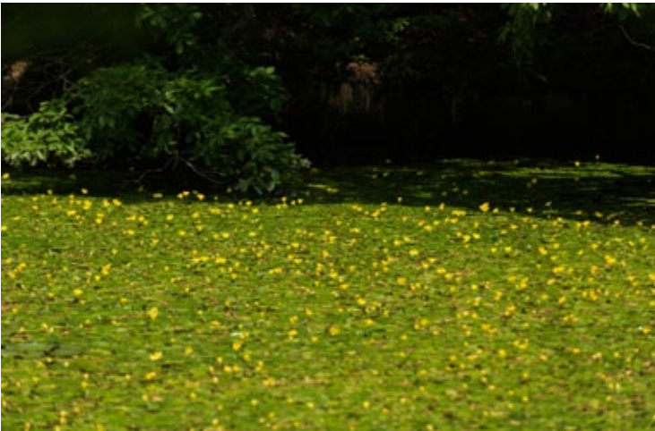
▲ สีเหลืองสดดูเด่นแต่ไกล

พบว่าตามริมเขื่อนคอนกรีตที่น้ำมีกวดอกไม้เล็กๆ สีเหลืองสดบานอยู่เป็นหย่อมๆ จากการค้นคว้าของผู้เชี่ยวชาญก็พบว่าอะสะซะลดจำนวนลง เพราะระดับน้ำในทะเลสาบที่เปลี่ยนไป น้ำที่ไม่สะอาด หญ้าโยะชิที่เป็นตัวช่วยให้ต้นอะสะซะแตกกิ่งขยายพันธุ์ถูกทำลายลง พวกเขาจึงร่วมกันจัดทำ “กองทุนอะสะซะ” เปิดห้องเรียนให้เด็กๆ ได้ศึกษาความสำคัญของสภาพแวดล้อม หาทุน และระดมกำลังช่วยกันดูแลปลูกดอกอะสะซะที่ลดจำนวนลง หลายปีต่อมาอะสะซะก็เพิ่มขึ้นอย่างต่อเนื่องจนกลายเป็นแหล่งชมดอกอะสะซะใหญ่ในภูมิภาคคันโตทุกๆ ฤดูร้อน เนื้อไปกว่าอื่นใด น้ำในทะเลสาบคะสุมิงะอุระก็ค่อยๆ กลับมาใสสะอาดพอที่ดอกอะสะซะจะสามารถดำรงชีวิตอยู่ได้