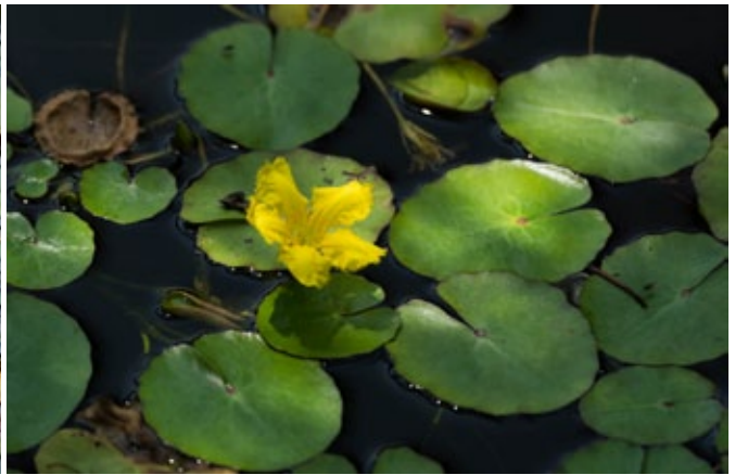
▲ ดอกอะสะซะจะมีกลีบ 5 กลีบ เกสรที่เห็นตรงกลางจะกลายเป็นเมล็ดขยายพันธุ์ได้