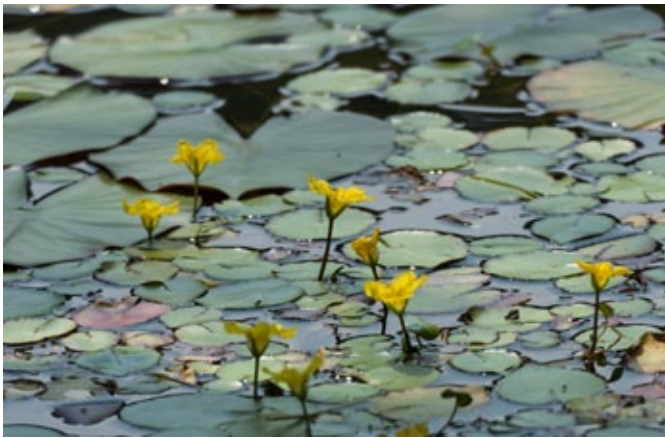
▲ อายุของดอกสั้นเพียงครึ่งวัน ช่วงบ่ายก็จะโรยไป