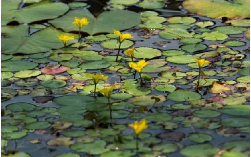
▲ ดอกจะบานพ่นน้ำขึ้นมาเล็กน้อยในช่วงเช้าวันที่มีแดดในฤดูร้อน

ที่มาของชื่อของ “อะสะซะ” หรือ “อะสะซะ” นั้นว่ากันว่ามาจากการเป็นดอกไม้ที่บานเฉพาะช่วงเช้า “อะสะสะคุ” หรือบานในน้ำตื้น “อะสะสะคุสะคุ” หรือรากที่พันกันได้ดิน “อะสะสะนะบุ” บางคนก็เชื่อว่าเนื่องจากใบอ่อนๆ ของมันถูกเรียกว่า “อะสะสะจุนไซ” หรืออะสะสะสะสะสะ” ซึ่งหมายถึงผักที่โตในน้ำตื้นกินได้ ต่อมาเสียงจึงแปลงมาเป็น “อะสะซะ” ในปัจจุบัน