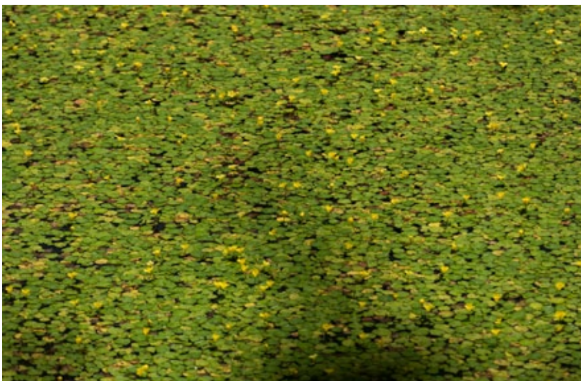
▲ ใบเล็กๆ มีหนักตรงกลางคล้ายรูปหัวใจ ใบอ่อนกินได้

ที่ว่าดอกอะสะซะที่เคยพบทั่วไปตามธรรมชาติค่อยๆ สูญพันธุ์ไปแล้วในหลายต่อหลายจังหวัด เช่น ในโอซากา เกียวโต เอะฮิเมะ ทตโตะริ กระทรวงสิ่งแวดล้อมญี่ปุ่น จึงขึ้นทะเบียนไว้ใน Red Data Book เป็นพืชอนุรักษ์ใกล้สูญพันธุ์