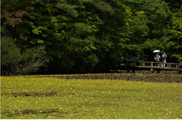
▲ Nakatani-ike ป่าพฤษศาสตร์โกเบ