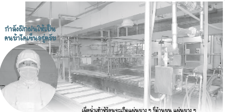
กำลังฝึกฝนใช้เครื่อง คนบ้าโคเซ็นอยู่ครับ

เป็นบริษัทที่มีสาขาทั่วประเทศเต้าหู้ ฟองเต้าหู้ บริษัทแห่งนี้ตั้งอยู่ที่อำเภอคุรุเมะ จังหวัดฟูกูโอกะ การสัมภาษณ์ คนบ้าโคเซ็นในฉบับนี้ ถ่ายทำที่โรงงานคามิซากิ จังหวัดซากะ