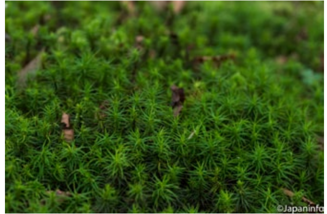
▲ หากดูใกล้ๆ จะพบว่าต้นโคเคะสลบซับซ้อนไม่น้อย

จากนั้นมาเธอก็ออกเที่ยวไปทั่วประเทศตามแหล่งที่มีโคเคะ งามๆ พร้อมรวบรวมภาพวาดของโคเคะกว่า 50 ชนิดที่ไปพบ ปรากฏว่าหนังสือขายดิบขายดีถึงราว 40,000 เล่ม นอกจากหนังสือแล้ว ทุกวันนี้ผู้คนยังพากันหาซื้อโคเคะ พันรอบก้อนดินเล็กๆ มาประดับเป็นไม้ในห้องหับกันอีกด้วย