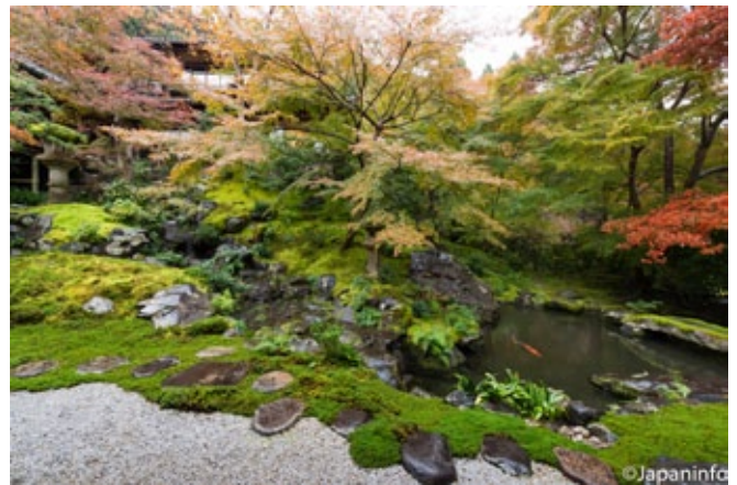
▲ นักแต่งสวนจะวางโคะเคะพันธุ์ต่างๆ กันตามแสง และปริมาณน้ำที่แต่ละจุดจะได้รับ