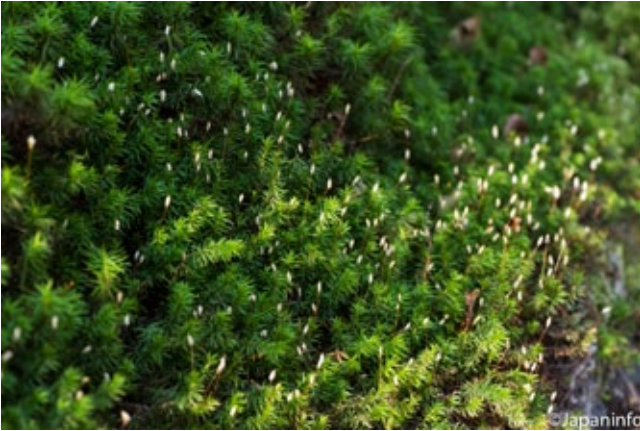
▲ ดอกโคเคะสีชาวกำลังบานช่วงฤดูใบไม้ร่วง

เป็นความงามแบบ “วาบิซาบิ” ที่คนตะวันตกอาจมองข้ามไป ทว่าสำหรับคนญี่ปุ่นดูเรียบง่าย นิ่งเฉย แต่เมื่อเฝ้ามองใกล้ๆ แล้วจะเห็นความซับซ้อน และสง่างาม ด้วยเหตุนี้เองที่โคเคะถูกนำมาใช้เป็นไม้ประดับสวนแบบญี่ปุ่นหรือ “นิฮอนเทเอน” ที่จะขาดไม่ได้