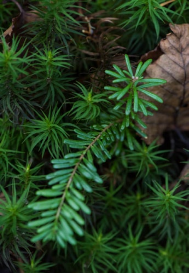
▲ พันธุ์ก้านยาวดั่งต้นคริสต์มาส