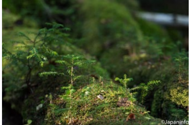
▲ โคะเคะในที่มีแสงน้อย