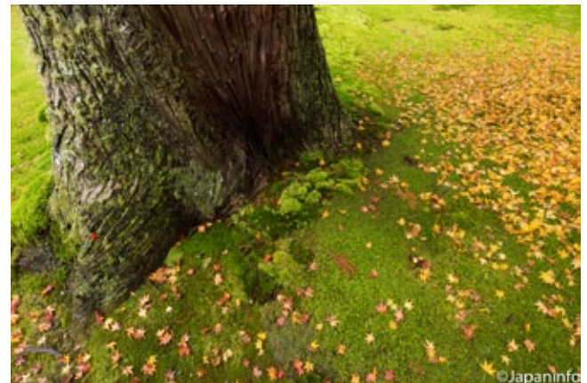
▲ โคะเคะสีเขียวดั่งมรกตปกคลุมสวนของวัด Sanzen-in ในเกียวโต