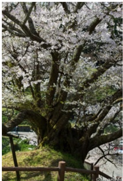
▲ ลำต้นของเซนเนง ซากุระที่วัดบุทซุริวจิ อายุ 900 ปี