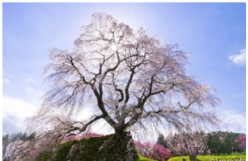
▲ มาตาเบอะ ซากุระดูโปร่งยามถ่ายย้อนแสง