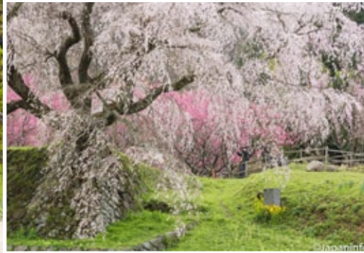
▲ สังเกตขนาดคนได้ต้นดู จะเห็นความใหญ่โตของมาตาเบอะ ซากุระได้ชัดเจน