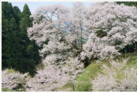
▲ เซนเนง ซากุระตระหง่านอยู่บนเนินเขา ตัวต้นเอนเอียงไปทั้งด้านล่าง และด้านบน

ซากุระต้นเดี่ยวๆ ที่ขึ้นตระหง่านจากอดีตถึงปัจจุบัน