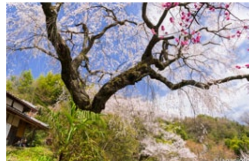
▲ ซากุระพันธุ์เดียวกับมาตาเบอะ ซากุระที่หน้ากุฏิร้าง วัดเทนนาสุจิ อายุ 250 ปี