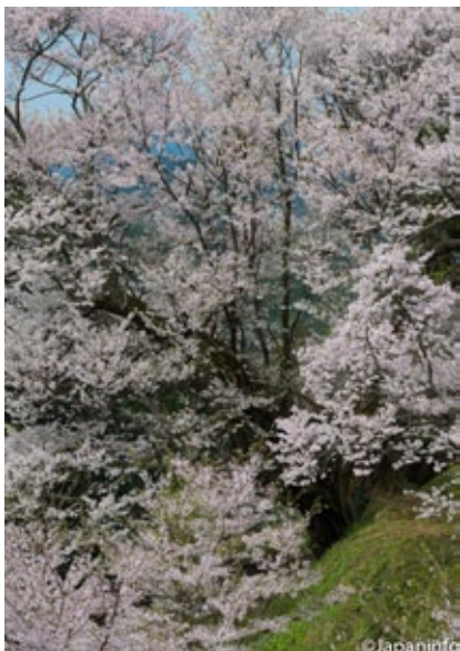
▲ แม้จะอายุ 900 ปี แต่เซนเนงซากุระยังให้ดอกดก ทุกปี