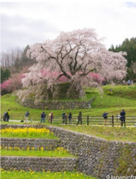
▲ มาตาเบะอิ ซากุระยืนตระหง่านอยู่ที่เนินที่อดีตเคยเป็นคฤหาสน์ของตระกูลโทะโตะ