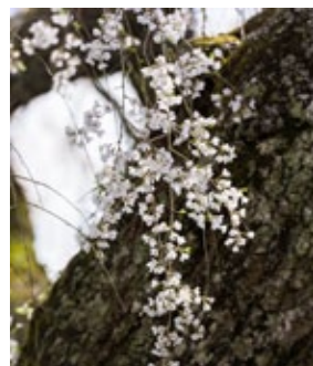
▲ ดอกจิ๋วๆ ของซากุระ พันธุ์เอโดะฮิงังซึ่งเป็นพันธุ์อายุยืนส่วนใหญ่

เรื่องราวที่เล่าขานกันมานี้จะจริงเท็จเพียงใดไม่เป็นที่ปรากฏ แต่จากกิ่งก้านที่สง่างามง้องลงมาด้านล่างประดิ้งสง่างาม และดอกเริง