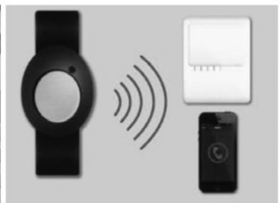
ภาพที่ 4 อุปกรณ์ที่เลือกใช้ภายในบ้าน Silver Gen