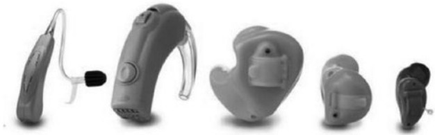
ภาพที่ 2 อุปกรณ์เครื่องช่วยฟัง