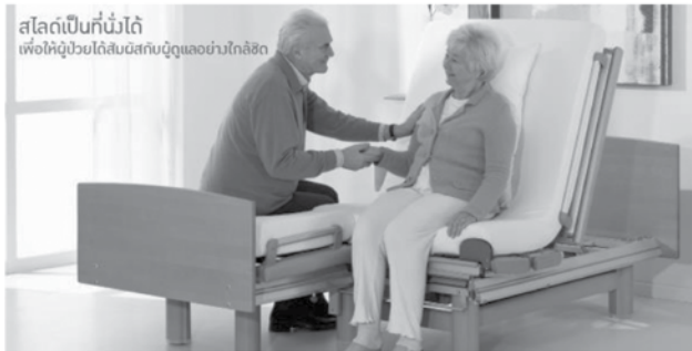
ภาพที่ 5 เตียงพร้อมที่นอนปรับระดับได้

นอกเหนือจากอุปกรณ์ต่างๆ ที่เป็นองค์ประกอบหลักแล้วนั้น เฟอร์นิเจอร์สำหรับผู้สูงอายุก็มีความสำคัญเช่นเดียวกัน กลุ่มคนเหล่านี้มีข้อจำกัดในการดำเนินชีวิตเนื่องจากสภาพร่างกายเริ่มเสื่อมถอย ดังนั้น ผู้ประกอบการในธุรกิจเฟอร์นิเจอร์ และเครื่องใช้ภายในบ้าน โดยเฟอร์นิเจอร์ได้แก่ เตียงนอนที่สามารถปรับระดับได้ และไม่สูงเกินไป เพื่อการลุกนั่งที่สะดวก ที่นอนยางพาราที่มีความแข็งแรง แก้วน้ำที่มีฟังก์ชัน และหมอนสำหรับผู้สูงอายุ เป็นต้น