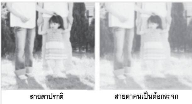
สายตาปกติ

ในชีวิตประจำวัน สีเข้ามามีอิทธิพลต่อการดำรงชีวิตของมนุษย์ ตั้งแต่ลืมตาตื่นนอนจนเข้านอนก็ว่าได้ สีส่งผลต่อความรู้สึกของมนุษย์ไม่ว่าในเรื่องของอาหารที่ทำให้มองดูน่าอร่อย รู้สึกเจริญอาหาร หรือแม้แต่ช่วยสร้างบรรยากาศความรู้สึกให้ดูสดใสสว่างได้ ในการเลือกสีในชีวิตประจำวันของเราเองนั้นมีความรู้สึกสนุกสนานกันบ้างหรือไม่? สังคมในยุคปัจจุบันไม่ว่าจะเป็นประเทศญี่ปุ่นหรือแม้แต่ประเทศไทยเราเองก็ตาม กำลังเข้าสู่สังคมผู้สูงอายุซึ่งภายในปี 2025 นั้นแทบจะกล่าวได้ว่าในคน 4 คนจะพบผู้สูงอายุ 1 คน สำหรับผู้สูงอายุ นั้นมักจะมีประสบปัญหาในเรื่องของการมองเห็น เช่น ปัญหา ต้อกระจก เป็นต้น ซึ่งจากเดิมที่เคยมองเห็นได้ชัดเจนก็เปลี่ยนแปลงไปตามกาลเวลา ทำให้การใช้ชีวิตประจำวันไม่สะดวกสบายเหมือนเดิม สายตาของผู้สูงอายุนั้นโดยส่วนใหญ่เริ่มที่จะพร่ามัว นอกจากนี้ ถ้ามีสภาวะต้อกระจกร่วมด้วยจะทำให้สภาวะการมองเห็นนั้นมีความคล้ายกับสีเหลืองของฟิลเตอร์ที่มีลักษณะค่อนข้างขุ่น