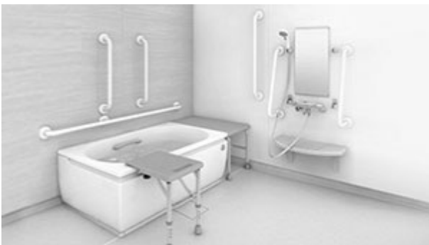
ภาพประกอบเว็บไซต์ toto japan ห้องน้ำสำหรับผู้สูงอายุ

นอกจากนี้ได้มีการสำรวจพบว่าภายในบ้านจุดที่เกิดอุบัติเหตุได้ง่ายเป็นอันดับต้นๆ นอกจากบริเวณบันไดแล้วยังพบว่าห้องน้ำก็เป็นจุดเสี่ยงที่สำคัญ ห้องน้ำกับการใช้สีมีผลอย่างไรต่อการรับรู้ของผู้สูงอายุ ในสมัยก่อนถ้าพูดถึงคำว่าน้ำ ส่วนใหญ่ก็จะนึกถึงสีฟ้า ทำให้ในประเทศญี่ปุ่นเองใช้สีฟ้าค่อนข้างมากในการออกแบบห้องน้ำ ซึ่งโทนสีเย็นนั้นถ้าเทียบกับโทนสีร้อนโดยการมองผ่านสายตาส่งข้อมูลการรับรู้สีไปยังสมองจะให้ความรู้สึกที่เย็นกว่าโทนสีร้อนถึง 3 องศา ดังนั้นสำหรับผู้สูงอายุแล้วพอเข้าสู่ฤดูหนาวการใช้สีฟ้าในห้องน้ำนั้นจะส่งผลกระทบต่อระบบการเดินของหัวใจ เนื่องจากให้ความรู้สึกที่เย็นกว่าปกติ ทำให้ในปัจจุบันห้องน้ำสำหรับผู้สูงอายุมักจะถูกออกแบบเลือกใช้โทนสี Warm Beige เพื่อสร้างความรู้สึกที่ไม่เย็นจนเกินไป