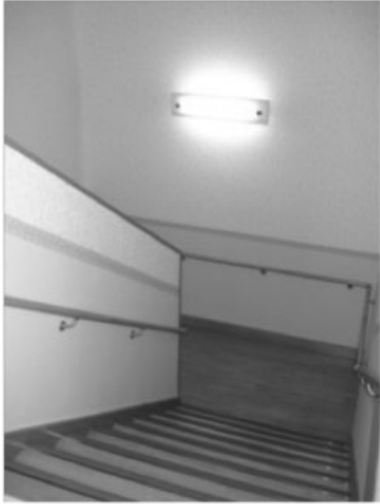
ภาพประกอบเว็บไซต์บ้านพักคนชราประเทศญี่ปุ่น บริเวณราวบันได

เป็นพิเศษสำหรับผู้สูงอายุ เช่น จุดเริ่มของบันไดในชั้นแรก จนถึงขั้นสุดท้ายใช้สีที่มองเห็นได้ชัดทำเป็นจุ่มบันได เพื่อผู้สูงอายุสามารถแยกแยะขั้นบันไดได้ง่าย หรือแม้แต่ปลั๊กไฟเอง ก็ตามอาจจะทำสติ๊กเกอร์สีแดงเพื่อเป็นจุดสังเกตบริเวณที่จะทำการเสียบสายไฟ