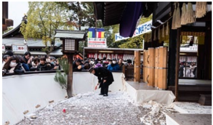
▲ ผู้คนพากันเบียดเสียดเข้าไปที่ศาลซุมิโยชิ ไทชะในโอซากาเพื่อโยนเงินทำบุญ