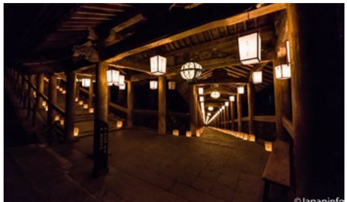
▲ โคมอันดงทั้งบนและล่างของระเบียงโนะโบะริโร จากประตูขึ้นไปสู่โอบิสต์บนเนินเขารักฮาเสะเด