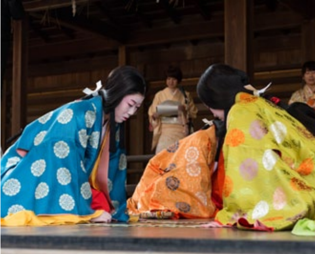
▲ หญิงสาวในอาภรณ์สมัยเฮอันกำลังเล่นกวาดไฟศาลเจ้า

มักจะสิ้นสุดราววันที่ 7 มกราคมเมื่อเด็ก ๆ เปิดเทอมฤดูหนาว ส่วนผู้ใหญ่จะเริ่มไปทำงานอีกครั้งจากราววันที่ 4 มกราคม โดยในสัปดาห์แรกพนักงานส่วนใหญ่จะยังไม่เริ่มงานกันจริงจึงตลาดหลักทรัพย์จะจัดพิธีรวมพล มีพนักงานหญิงในชุดกิโมโนงาม ๆ มาร่วมประพมือ โบรกเกอร์จะช่วยกันซื้อหุ้นเอาเคล็ดให้ราคาหุ้นทะยานขึ้นสูงในพิธี "ไต่ฮักโก" ในช่วงเช้า และจะปิดตลาดในช่วงบ่าย พนักงานบริษัททั่วไปจะพบปฏิทินหรือของชำร่วยเวียนไปสวัสดีลูกค้า เพื่อกิจการและความสัมพันธ์ที่ราบรื่นในปีที่มาถึงใหม่