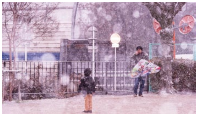
▲ พอลูกออกมาเล่นว่าในเช้าวันปีใหม่ใหม่ๆ ที่หิมะโปรยปรายลงมาค่อนข้างหนัก