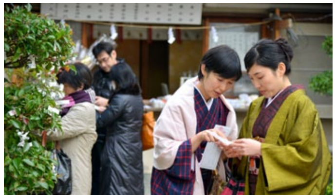
▲ เข้าวันปีใหม่ที่ศาลชินโตเล็กๆ ก็เต็มไปด้วยผู้คนที่ตั้งบ้านเรือนใกล้ๆ หลายคนที่เรียดกับเนื้อหาของเซียมซีแรกของปี

การถือเคล็ดถือโชคลาง และพิธีต้อนรับเทพเจ้าปีใหม่ข้างต้น จะไปสิ้นสุดเอาหลังจาก "พิธีคะงามิบิรากิ" นำเอาข้าวเหนียวคางามิโอะจิมาฝากินรับพลังจากเทพเจ้าในวันที่ 11 มกราคม และเก็บกวาดเครื่อง-ประดับบ้านทั้งหลายราววันที่ 8 กุมภาพันธ์ (โอะโตะโอะสาเมะ) ในอดีต แต่จากความเร่งรีบในปัจจุบัน บรรยากาศปีใหม่