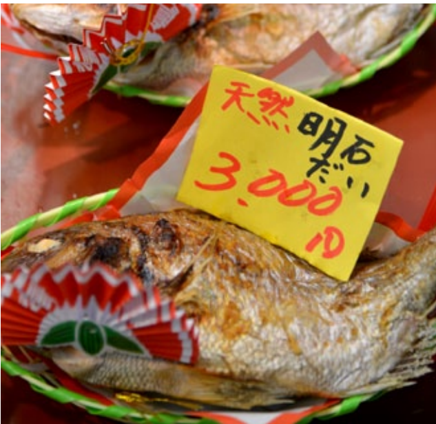
▲ ปลากระพงขาวหรือ "โท" สื่อถึงสิ่งเป็นมงคล "เมเดโท" จึงกลายเป็นเครื่องเซ่นไหว้เทพเจ้าที่จะขาดไม่ได้ในเทศกาลปีใหม่