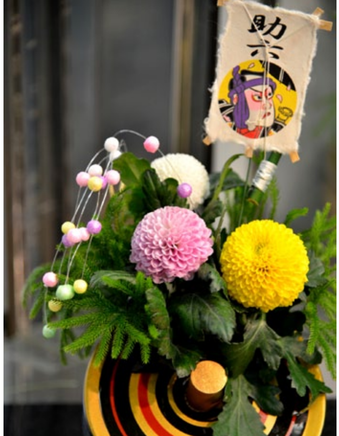
▲ แจกันดอกไม้ประดับ ด้านบนเป็นว่า ด้านล่างเป็นลูกข้าง