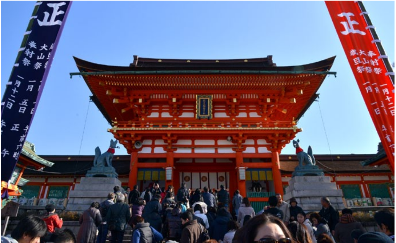
▲ แม้จะเข้าวันที่ศาลของเทศกาลปีใหม่ ผู้คนในคืนไซากยังหลงไหลไปที่ศาลฟูชิมิอินาริ ไทชะ

และเทพเจ้าที่ศาลชินโตนั้นเพิ่งจะมาเริ่มกันในสมัยเอโดะ เมื่อการคมนาคมสะดวกขึ้น เช่นเดียวกับธรรมเนียมการลั่นระฆัง 108 ครั้ง ที่ได้รับการถ่ายทอดมาจากพุทธศาสนาในประเทศจีนก็เพิ่งจะกลายมาเป็นธรรมเนียมในคืนก่อนวันปีใหม่ในสมัยคามาคูระ เมื่อพระสงฆ์ต้องการเผยแพร่วัดของตนให้เป็นที่รู้จักแพร่หลาย