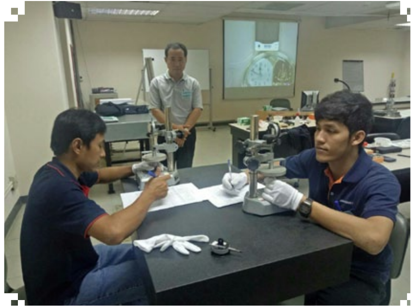
บรรยากาศ การทดสอบ (ภาคปฏิบัติ) อาชีพผู้สอบเทียบเครื่องมือวัดด้านมิติ