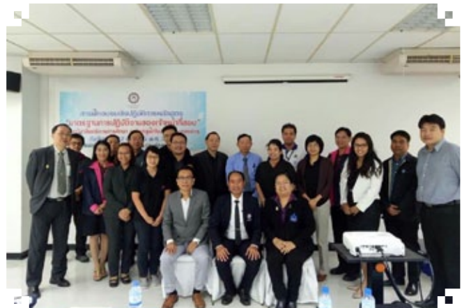
อบรมเจ้าหน้าที่สอบ