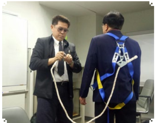
บรรยากาศการทดสอบ อาชีพครูฝึกในสถานประกอบการ ชั้น 3