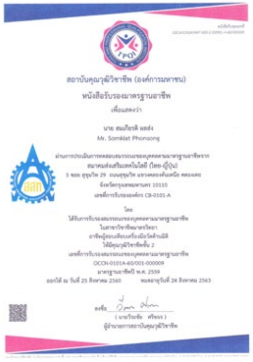
ผู้ผ่านการสอบจะได้รับใบหนังสือรับรองมาตรฐานอาชีพ ผู้ผ่านการประเมินทดสอบสมรรถนะของบุคคลตามมาตรฐานอาชีพ

และ ส.ส.ท. ยังได้รับความไว้วางใจจาก กรมพัฒนาฝีมือแรงงาน ให้เป็นศูนย์ประเมินความรู้ความสามารถตามมาตรา 26/4(2) เลขที่ ss1896003 สมาคมส่งเสริมเทคโนโลยี (ไทย-ญี่ปุ่น) มีหน้าที่ ประเมินเพื่อรับหนังสือรับรองความรู้ ความสามารถ ช่างไฟฟ้าภายในอาคาร ตาม พ.ร.บ.ส่งเสริมการพัฒนาฝีมือแรงงาน (ฉบับที่ 2) พ.ศ.2557