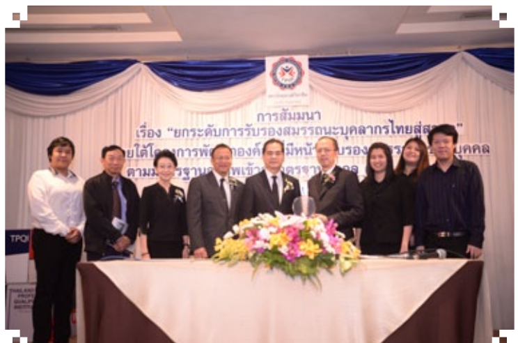
ส.ส.ท. รับโล่ภายใต้โครงการพัฒนาองค์กรที่มีหน้าที่รับรองสมรรถนะของบุคคลตามมาตรฐานอาชีพเข้าสู่มาตรฐานสากล (ISO/IEC17024)