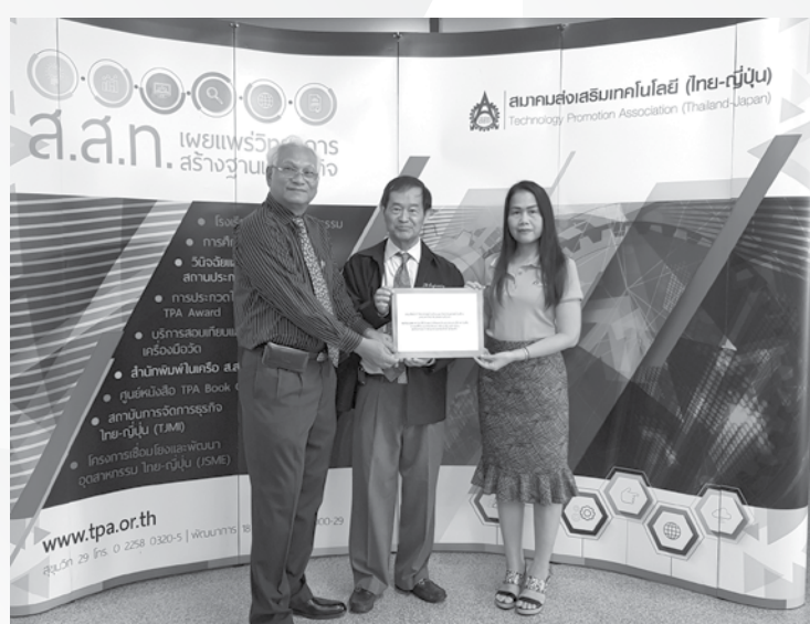
(ขอขอบคุณคณะศิษย์เก่า มหาวิทยาลัยสงขลานครินทร์)