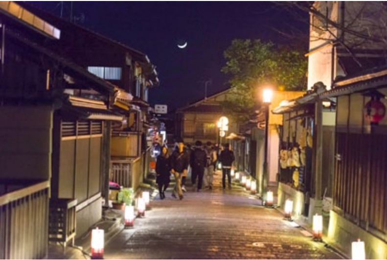
▲ นักท่องเที่ยวจะพลุกพล่านบริเวณเนินนินซากะ

“อิเคบานะ” ถือกำเนิดขึ้นเพื่อถวายดอกไม้บูชาพระพุทธรูปเมื่อพุทธศาสนาถูกเผยแพร่เข้ามายังญี่ปุ่นในสมัยนารา สำนักอิเคบานะโบในเกียวโตถือเป็นสำนักแรกๆ ที่ก่อตั้ง “คะโด” หรือศาสตร์แห่งการประดับดอกไม้เป็นที่รู้จักกันทั่วโลก อิเคบานะจึงเป็นสิ่งที่ขาดไม่ได้เมื่อพูดถึงรากลึกด้านวัฒนธรรมของเกียวโต “อิเคะ” หมายถึง “การมีชีวิต” ไม่ใช่ “การประดับ” ดอกไม้ฝีมือปรมาจารย์ด้านอิเคบานะจึงออกมาในรูปแบบที่ใกล้เคียงธรรมชาติ