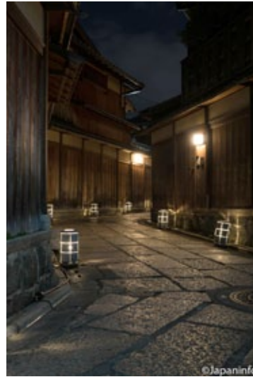
▲ สองข้างทางเป็นรั้วที่ทำด้วยไม้ ให้บรรยากาศเก่าแก่ดี