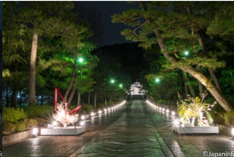
▲ โคมอันดงและการประดับดอกไม้ที่บริเวณ Otani Honbyo สุสานของพระสงฆ์ผู้ก่อตั้งวัด Honganji

แห่งหนึ่งในญี่ปุ่น ส่วนขบวนแห่ "ฮิโนะโยจิน" นั้นในปัจจุบันก็ยังพบได้ทั่วไปช่วงปลายปีเมื่ออากาศหนาวเย็น ผู้คนพากันใช้เตาผิงไฟเป็นสาเหตุให้เกิดเพลิงไหม้ได้เกิดขึ้น เด็กๆ และคนในตำบลจะผลัดเวรกันตักล่องร้องเป่า "ฮิโนะโยจิน" เรียกร้องให้ทุกคนระวังไฟให้ดี เกียวโตในอดีตขึ้นชื่อว่ามีเพลิงไหม้อยู่เนืองๆ เนื่องจากบ้านเรือนไม้เล็กๆ เรียงรายกันแน่นขนัด แต่ละบ้านต่างพากันนำเอาถังน้ำสีแดงที่มีน้ำเต็มถึง วางไว้หน้าบ้านกันมาจนทุกวันนี้