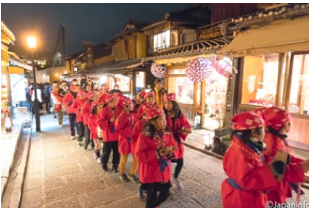
▲ เด็กสวมเสื้อฮิโตะแดงกับหมวก ช่วยกันตีฉาบบอกให้ระวังพื้นไฟ

“อิเคบานะ” ถือกำเนิดขึ้นเพื่อถวายดอกไม้บูชาพระพุทธรูปเมื่อพุทธศาสนาถูกเผยแพร่เข้ามายังญี่ปุ่นในสมัยนารา สำนักอิเคบานะโบในเกียวโตถือเป็นสำนักแรกๆ ที่ก่อตั้ง “คะโด” หรือศาสตร์แห่งการประดับดอกไม้เป็นที่รู้จักกันทั่วโลก อิเคบานะจึงเป็นสิ่งที่ขาดไม่ได้เมื่อพูดถึงรากลึกด้านวัฒนธรรมของเกียวโต “อิเคะ” หมายถึง “การมีชีวิต” ไม่ใช่ “การประดับ” ดอกไม้ฝีมือปรมาจารย์ด้านอิเคบานะจึงออกมาในรูปแบบที่ใกล้เคียงธรรมชาติ