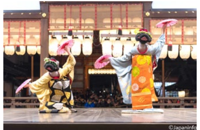
▲ ผู้คนพากันไปชมการแสดงของไมโกะหน้าศาลาญูเดงศาลยาซากะ

เทศกาลฮิงาชิยามา ฮานะโทะโรเริ่มขึ้นเป็นครั้งแรกเมื่อเดือนมีนาคมปี 2003 วัดอุประสงค์หลักเพื่อตั้งคูดนักท่องเที่ยวกะตุ้นเศรษฐกิจของเมืองในฤดูหนาวเมื่อผู้คนเดินทางมาน้อย และเพื่อแนะนำความงามดั้งเดิมของเกียวโตที่มีจุดเด่นอยู่ที่ตรอกซอกซอยถนนหินที่เป็นเนินกวานไปมา เรียงรายไปด้วยบ้านเรือนร้านค้า และวัดวาอารามที่ได้รับการขึ้นทะเบียนเป็นมรดกของประเทศมากมาย