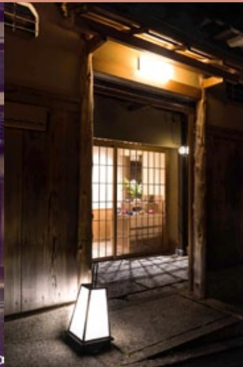
▲ แสงไฟที่ลอดออกมาจากร้านค้า ย่านอิงาชิยามาในยามเทศกาล