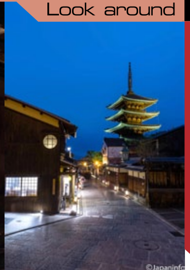
▲ บรรยากาศงามๆ ที่ใกล้เจดีย์ ยาสากะโนะโท