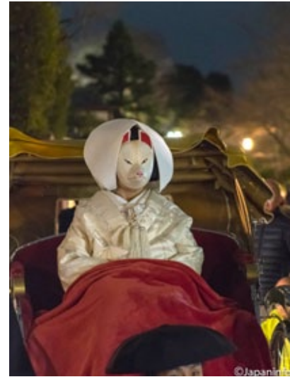
▲ ขบวนของเจ้าสาวสวมหน้ากากหมาจิ้งจอก

หลังดื่มด่ำกับความงามของอิเคบานะสักพัก จึงเดินไปที่ศาลยาสากะ ศาลชินโตซึ่งบรรดาเกอิโกะ และไมโกะย่านกิงงันบัตสึที่นี้ในช่วงเทศกาลจะมีการรำถวายเทพเจ้าของพวกเธอที่จัดแสดงทุกค่ำวันเสาร์อาทิตย์ ไมโกะผัดหน้าขาวนวลในชุดกิโมโน “อิคิทสุริ” และ “ตาราริโอบิ” ผ้าไหมมัดเอวฝีมือช่างทอตำบลนิชิจินกำลังรำรำด้วยร่มดอกไม้ที่ด้านข้างเวที โดยมีเกอิโกะดีดซามิเซนสอดอยู่ แสงออกเหลืองๆ อมทอง ที่สาดส่องมาจากโคมกระดาษ “โຈจิน” ที่ประดับเรียงซ้อนกันเป็นชั้นๆ รอบชายคาศาลเพิ่มความขลังให้กับการรำรำได้อย่างลงตัว เช่นเดียวกับอิเคบานะ “เกอิโมโกะ” ก็เป็นปัจจัยอีกประการหนึ่งที่ขาดไม่ได้เมื่อพูดถึงเกียวโต