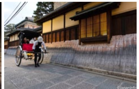
▲ นักท่องเที่ยวนิยมนั่งรถลากชมเทศกาล