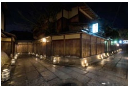
▲ ถนนอิชิเบะโคจิเป็นถนนอนุรักษ์ที่เงียบสงบ

* ผู้อ่านที่อยากสัมผัสผัสเกียวโตในอดีตสามารถมาเที่ยวชมเทศกาลได้จากราวต้นถึงกลางเดือนมีนาคมทุกปี