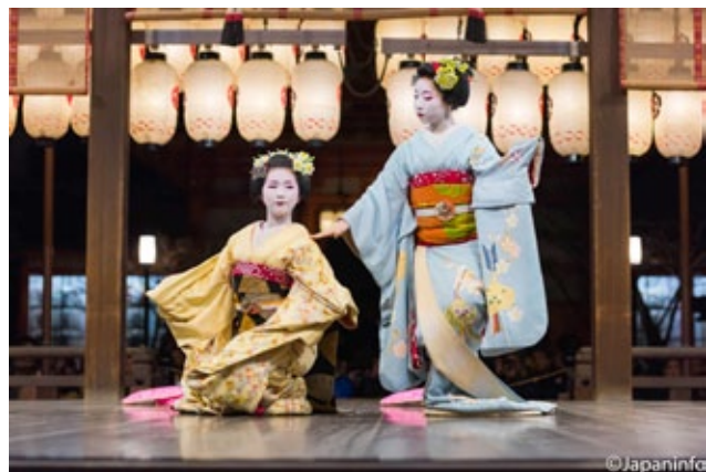
▲ การแสดงรำของไมโกะที่เวทีบุแดงศาลยาสากะ