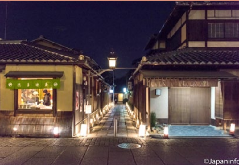
▲ บริเวณถนนเนะเนะโนะมิจิ