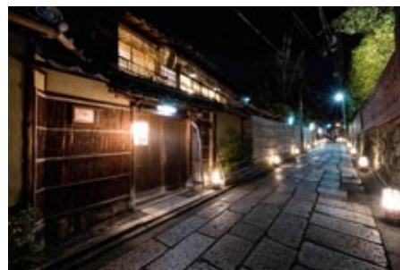
▲ อีกส่วนหนึ่งของถนนอิชิเบะโคจิ