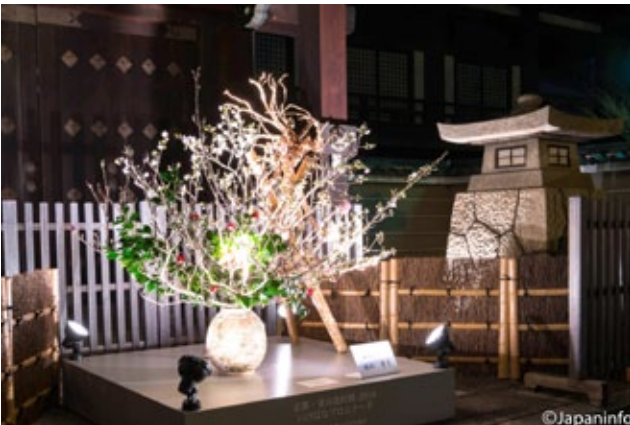
▲ อีเคะบานะวางประดับตามจุดต่างๆ