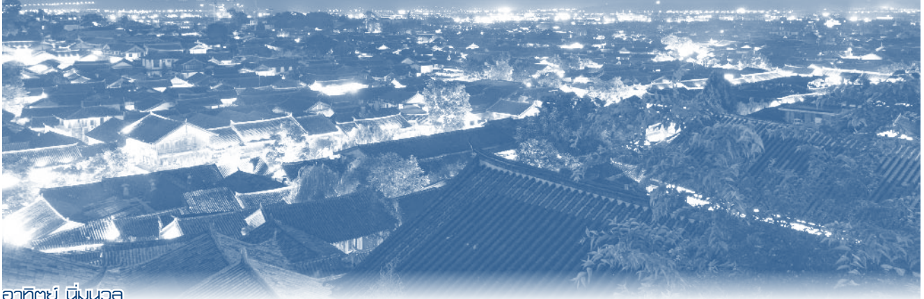
อาทิษย์ ติ่มนวล สำนักพิมพ์ภาคประชาสังคม ส.ส.น.

ความ เดิมตอนที่แล้ว...ที่ทีมงานคุณภาพของเราได้ทำการจองตั๋วไปตะลุยภูเขามังกรหิมะเสร็จเรียบร้อย (玉龙雪山หรือหิมะเสวี่ยซาน) และได้ข้อมูลติดต่อสารที่ที่จะพาเราไปสู่ดินแดนแห่งธรรมชาติ และอารยธรรมมาแล้ว ความประทับใจแรก คือ รูปโปรไฟล์ของเธอในแอปฯ WeChat หรือ 微信 (เว่ยซิน) ช่วงสวยงาม หุหุหุ ใสมาก ประดุจ Miss Grand ประจำจังหวัดสี่เฉียงมาก ๆ ขณะที่เราเฝ้ามองอยากเห็นตัวจริงคุณพี่เขาไว ๆ คงน่าตื่นตื่นดีพิลึก อ้อ จะบอกว่า ถ้าใครจะมาท่องเที่ยวในประเทศจีน อยากให้หาข้อมูล และดาวน์โหลดแอปฯ ช่วยชีวิตต่างๆ ติดมือถือไว้ด้วยก็จะดีมากนะ เพราะที่นี้เขาบล็อกแอปฯ สามัญที่ใช้กันเยอะๆ ในบ้านเราแล้วเขาก็ใช้แอปฯ ของเขาตัวเอง ซึ่งมันก็สมเหตุสมผลดี ประชากร