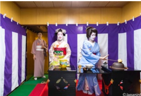
▲ ห้องเล็กๆ ด้านในศาลถูกแปลงเป็นห้องน้ำชาชั่วคราว

ไม่ว่า จะบ้านเล็กเมืองน้อยแค่ไหนก็ตาม ทุกหมู่บ้านทุกตำบลในญี่ปุ่นจะมีศาลชินโตตั้งอยู่มาแต่โบราณกาล จากข้อมูลของกระทรวงศึกษาธิการญี่ปุ่นในปี 2016 พบว่ามีศาลชินโตกระจายอยู่ทั่วประเทศกว่า 80,000 ศาล มากกว่าจำนวนร้านสะดวกซื้อทั่วประเทศในเดือนเมษายน ปี 2019 ที่เท่ากับราว 55,000 ร้านเสียด้วยซ้ำ โดยหลักการแล้ว ไม่ว่าจะเป็ศาลเล็กหรือใหญ่โตเพียงใด ในปีหนึ่งก็จะมีเทศกาล "ไทโช" ประจำศาลอย่างน้อยหนึ่งครั้ ผู้ที่ทำหน้าที่จัดเทศกาลก็คือเจ้าอาวาสศาล และชาวบ้านใกล้เคียง ที่อยู่ในฐานะ "ศิษยานุศิษย์" หรือเรียกกันภาษาญี่ปุ่นว่า "อุจิโกะ"