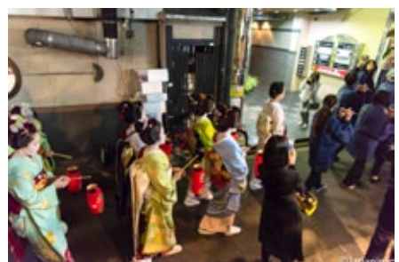
▲ ขบวนวนไปรอบตำบล