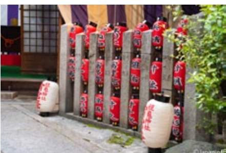
▲ โคมแดงมีชื่อเกอิโกะ และไมโกะแต่ละคน ประทับอยู่ถูกนำมาเรียงในศาล