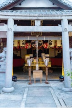
▲ เครื่องเซ่นพร้อมเพรียงแล้ว