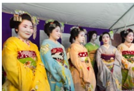
▲ ไมโกะพากันมารวมตัวที่เต้นท์ต่อหน้าผู้ชมที่เบียดกันแน่น