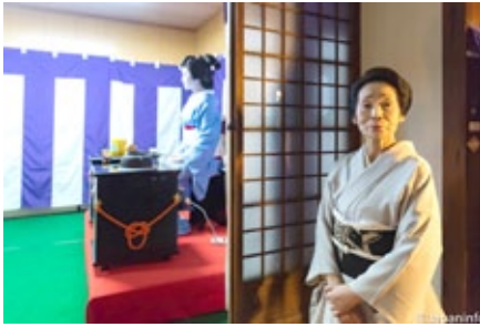
▲ โอกาซังเจ้าของสังกัดก็ออกมาสลับกันทำหน้าทีค้ในงาน