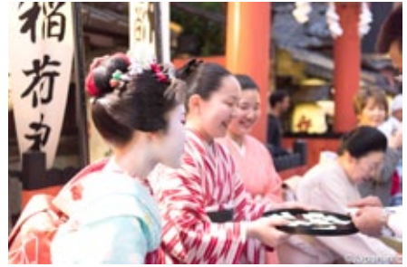
▲ ไมโกะ และเด็กฝึกหัดช่วยกันขายของที่ระลึก

การร่วมสนุกที่ว่าเป็นที่รู้จักกันในนามของ “โยมิมิยาไซ” หรือ “คืนวันสุกดิบ” เริ่มจากราว 18:30 น ที่ถนนแคบๆหน้าศาล ทั้งเกอิโกะ ไมโกะ โอกาซังเจ้าของแต่ละสังกัด เจ้าของร้านน้ำชา บาร์ คลับ เจ้าของร้านอาหารเครื่องดื่มหรือเจ้าของร้านค้าในตำบล จะแบ่งหน้าที่กันจัดการละเล่น ตั้งแต่การเล่นเกมส์จับสลาก การขายตัว เพื่อให้ผู้มาร่วมงาน ซื้อหาเครื่องดื่มของกิน ร่วมพิธีชิงชา และชมการรำรำดั้งงานวัดทั่วไป แต่ที่แตกต่างกับงานวัดทั่วไปก็ตรงที่แทบทุกคอร์เนอร์ให้บริการโดยบรรดาเกอิโกะ และไมโกะในชุดเต็มยศ นับเป็นโอกาสเดียวของคนทั่วไปที่จะได้เข้าไปใกล้หรือรับบริการจากพวกเขาโดยตรงก็ว่าได้