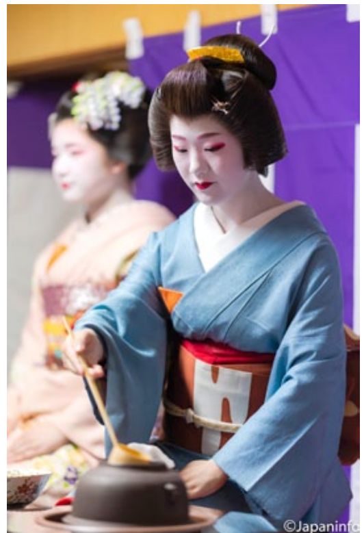
▲ เกอิโกะคนงามกำลังบรรจงชงชาให้กับแขกที่ซื้อบัตรมารับน้ำชาในห้องอย่างละเมียดละไม

ทุกต้นเดือนพฤษภาคม ศิษยานุศิษย์ในตำบลกิ่งฮิงาชิจะร่วมกันจัดเทศกาลไทโช เช่นไหว้เทพเจ้าให้ปกป้องรักษาทุกคนให้อยู่ร่มเย็นเป็นสุขท่ามาค้ำขึ้น โดยคนในตำบลนำขบวนโดยบรรดาเกอิโกะ และไมโกะของสำนักร่องฮิงาชิราว 20 คนจะพากันมานมัสการเช่นไหว้เทพเจ้าที่ศาลในช่วงเช้าหลังจากที่ได้ร่วมสนุกกันในคืนก่อนหน้านั้น