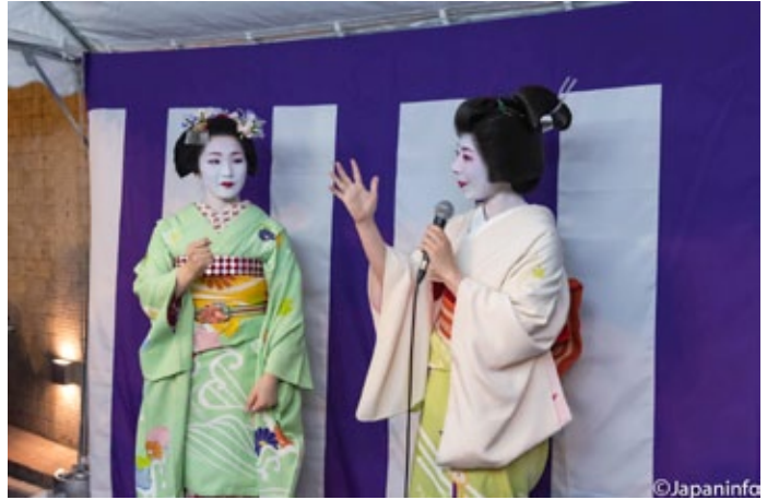
▲ สองคนสลักกันพาผู้ชมเล่นเกมสลับรางวัล มาเสิร์ฟแขกที่ที่นั่ง

ทางทิศใต้ หรือเท่ากับราวกว่า 14,000 ตารางเมตร