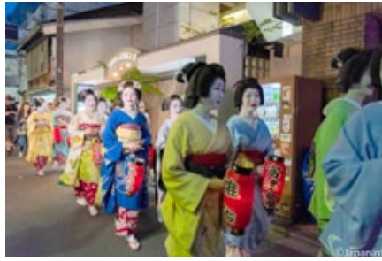
▲ พวกเขาออกเดินวนไปทักทายเจ้าของร้านค้าและผู้คนในตำบล