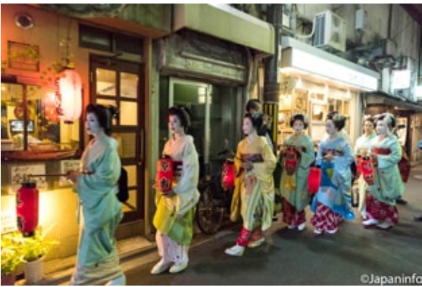
▲ ขบวนรอบดึกวนมาอีกครั้