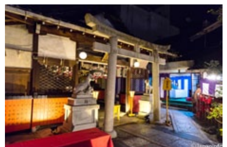
▲ ศาลคังคาเมะอินาริจินจะยามค่ำคืน