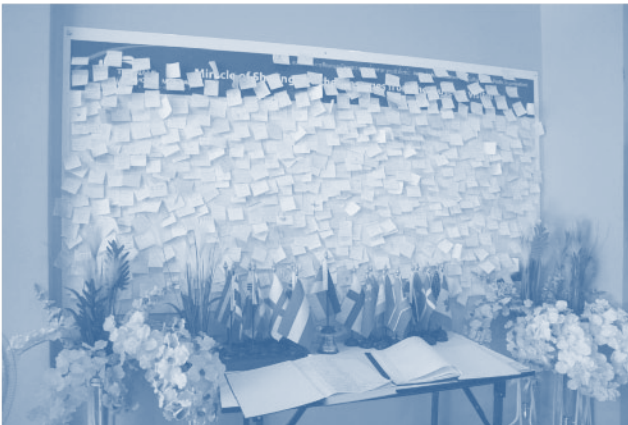
ข้อความระลึกถึงเหตุการณ์สึนามิ ปี พ.ศ.2547

เมื่อเดินเข้าไปที่ชั้นหนึ่งเราจะพบกับบอร์ดแสดงภาพถ่ายต่างๆ จากเหตุการณ์สึนามิ ปี พ.ศ.2547 มีโทรทัศน์ฉายคลิปวิดีโอที่คนต่างวัย และบทสัมภาษณ์ต่างๆ ที่ผนังด้านหนึ่งมีการจัดทำบอร์ดสำหรับเขียนข้อความระลึกถึงผู้ที่ได้รับผลกระทบจากเหตุการณ์ในครั้งนั้น จะเห็นได้ว่ามีข้อความหลากหลายภาษาถูกเขียนแปะไว้ในบริเวณบอร์ดนี้