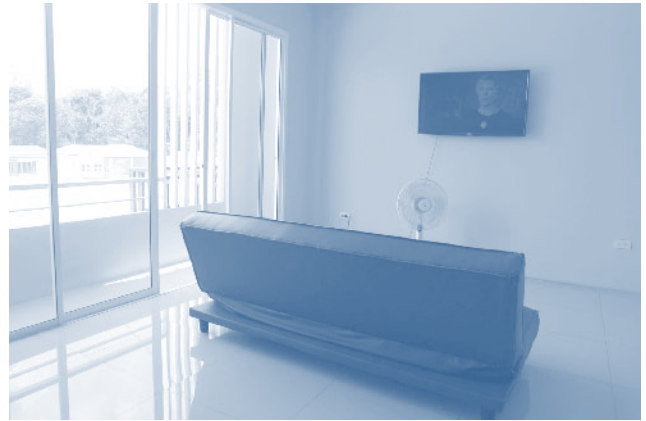
ห้องชมวีดิทัศน์

เห็นอนุสรณ์สถานสึนามิเรือ ต.813 ซึ่งผู้เยี่ยมชมหลายๆ ท่านมักจะเดินไปถ่ายภาพเยี่ยมชมก่อนจะเดินมาฝั่งตรงข้ามเพื่อเยี่ยมชมพิพิธภัณฑ์ฯ