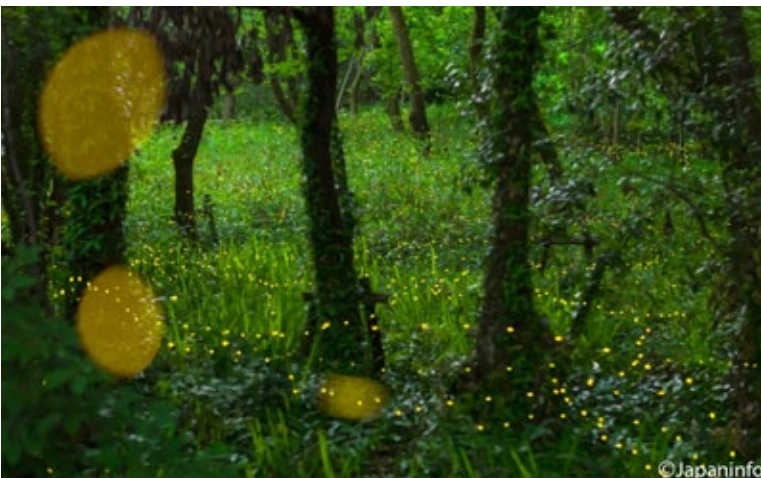
▲ อิเมะโอะตารุที่ป่ารกๆ ไม่ไกลจากบ้านชานกรุงโอซากา มีเจ้าหน้าที่คอยบำรุงรักษาสภาพแวดล้อมทุกปี