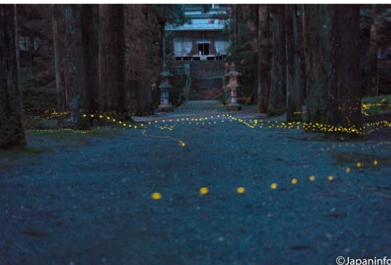
▲ ราวก่อนสองทุ่มในปลายเดือนมิถุนายนไปเจอกับฝูงอิเมะโอะตารุเป็นพันๆ ตัว แม้เพียงเปิดหน้ากล้องไว้ราว 20 วินาทีก็เห็นพวกมันบินเป็นทางยาว

เอโดะก็มีชาวบ้านกำลังเพลินกับการชมหิ่งห้อย และแม้ในปัจจุบันเด็กนักเรียนญี่ปุ่นก็ยังร้องเพลง “โอะตารุ โนะ อิการิ” (แสงเรืองรองของหิ่งห้อย) ที่ปรับทำนองมาจากเพลง Auld Land Syne ของสก็อตแลนด์กันอยู่ในวันจบการศึกษา ไม่ไกลจากบ้านผู้เขียนนักมีสถานีรถไฟชื่อ “Hotarugaike” แปลตรงตัวได้ว่า “สระหิ่งห้อย” สำหรับคนญี่ปุ่นหิ่งห้อยถูกจัดให้เป็นแมลงพิเศษและเป็นสัญลักษณ์ของฤดูร้อนที่สนุกสนาน และงดงามมาแต่ไหนแต่ไร