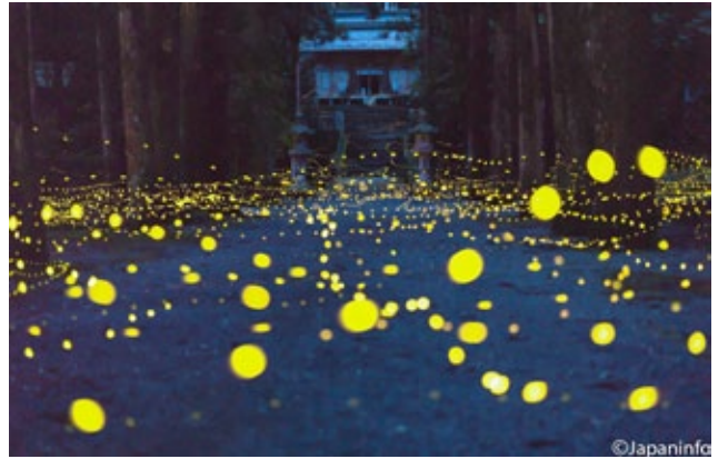
▲ ส่องรวมภาพฝูงสักราว 10 ภาพ โดยมีแสงหิ่งห้อยที่บินตัดหน้ากล้อง ระยะกระชั้นชิด

หิ่งห้อยเป็นแมลงที่พบได้ทั่วโลก พวกมันถือกำเนิดบนโลก ตั้งแต่เมื่อหลายแสนล้านปีก่อนที่มนุษย์จะถือกำเนิดด้วยซ้ำ เชื่อกันว่าทั่วโลกมีหิ่งห้อยมากกว่า 2,000 ชนิด ในญี่ปุ่นพบได้ในเกาะฮอนชู จนถึงใต้ลงมาราว 40 ชนิด แยกเป็นสามสายพันธุ์ใหญ่ๆ ได้แก่ เกนจิเฮคะ และฮิเมะ เกนจิโอะตารุ อาศัยตามลำน้ำที่ไหลเทได้ดี ตัวยาวราว 12-18 มิลลิเมตร ลำตัวจะออกเป็นสีแดงๆ เรืองแสงเป็นสีเขียว เฮคะโอะตารุมีถิ่นฐานเดียวกับเกนจิโอะตารุ แต่ตัวจะเล็กกว่ามีขนาดราว 7-10 มิลลิเมตร ฮิเมะโอะตารุอาศัยบนบกตามพงหญ้าในป่าที่ธรรมชาติสมบูรณ์ ตัวยาวราวไม่เกิน 7 มิลลิเมตร กระจิบแสงอ่อนๆ สีเหลืองราว 2 วินาที กินพวกหอยในดินเป็นอาหารยามเป็นตัวอ่อน ซึ่งกว่าจะฟักเป็นแมลงได้ก็ราว 1 ปีเต็มๆ เชื่อกันว่ากลิ่นเหม็นของพวกมันมีไว้ป้องกันตัว และแสงที่เรืองรองจากกันก็เพื่อส่งสัญญาณระหว่างตัวผู้ และตัวเมียเพื่อผสมพันธุ์ ตัวเมียไม่มีปีกจึงบินไม่ได้ แต่กระจิบแสงเรียกตัวผู้ให้บินมาหา หิ่งห้อยจึงมักจะบินกันตัวๆ ผู้รู้บอกว่าหิ่งห้อยจะมีสัญญาณกระจิบที่ต่างกันไปตามท้องถิ่น ต่างถิ่นกันก็ไม้อาจเข้าใจกันได้ พวกมันจะกระจิบแสง และผสมพันธุ์กันราว 1-2 สัปดาห์ก่อนที่จะออกไข่ และตายจากไป