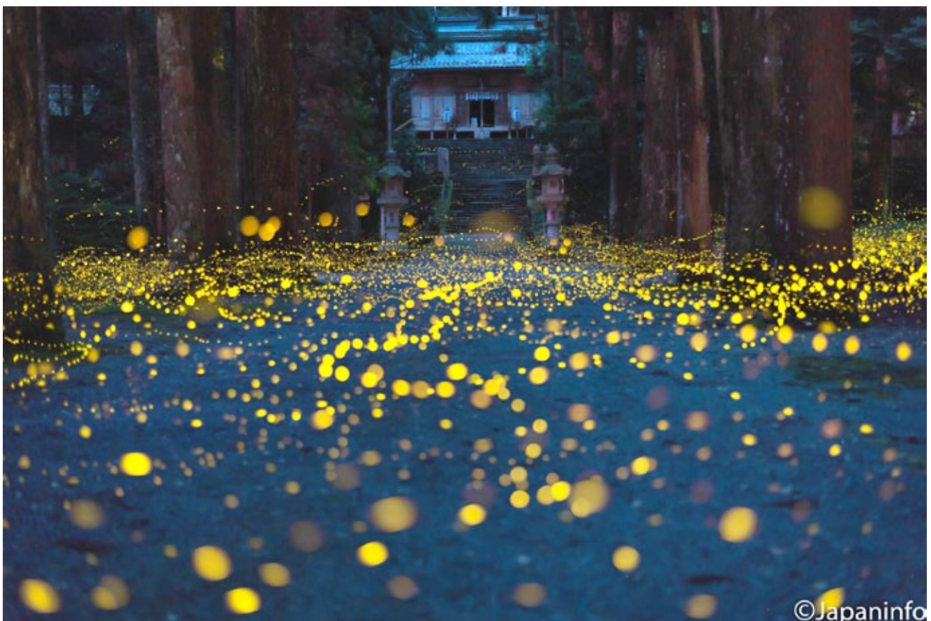
▲ แสงกระจิบสีเหลืองเล็กๆ ที่งดงามไม่รู้ลืม ทำให้เข้าใจความหมายของคำว่า “Hakanai” ได้เป็นอย่างดี

ด้วยเหตุนี้จึงพบชื่อของหิ่งห้อย (蛍= โอะตารุ) ปรากฏอยู่ในวรรณกรรมดั้งเดิม เนื้อเพลง สถานที่ ฯลฯ ของญี่ปุ่น ว่ากันว่าขุนนางสมัยเฮอันนิยมชมหิ่งห้อยที่เรืองแสงยามค่ำคืนเพียงไม่กี่ตัว มากกว่าแสงจากหิ่งห้อยเป็นร้อยเป็นพันตัว ภาพเขียนอุคิโยะเอะในปลายสมัย