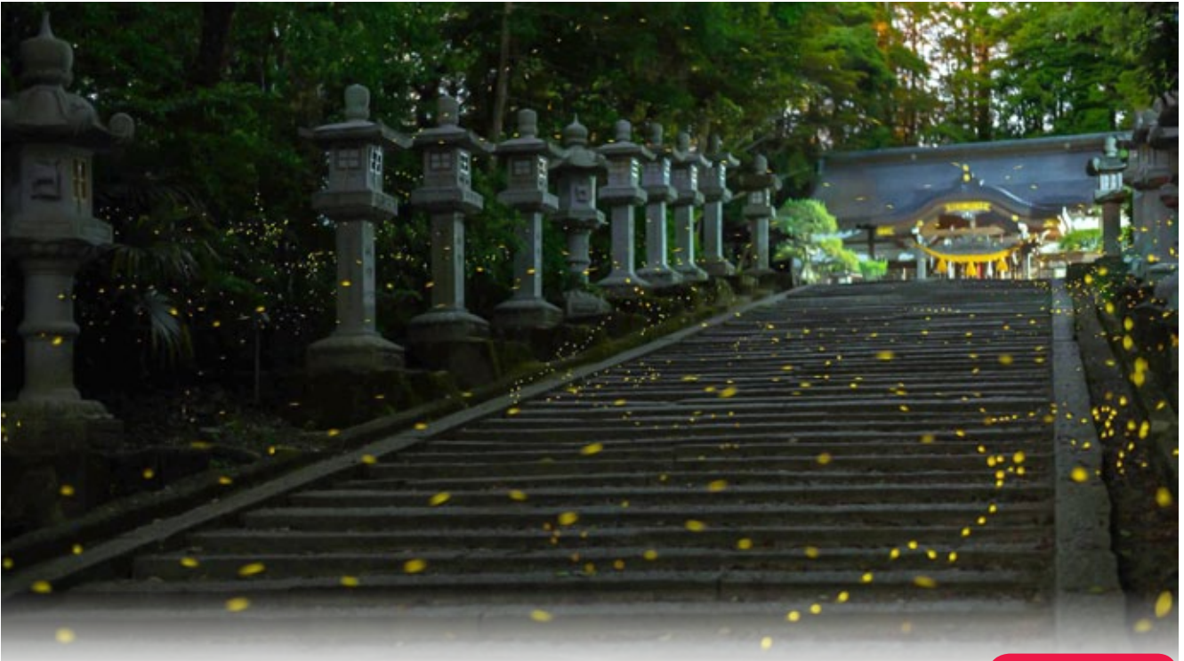
▲ อิเมะโอะตะคารุพากันออกมาจากพงหญ้าบินต๋าๆ ที่ศาลชินโตแห่งหนึ่งในเมืองมิโนซานกรุงไอซากา