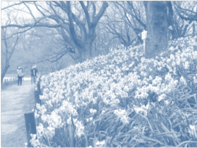
ดอกชิวเซง ในสวนคอนเงินโด ในจังหวัดไซตามะ