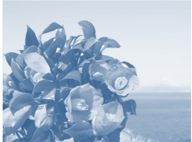
ดอกทสึบากิที่มีฉากหลังเป็นภูเขาไฟฟูจิ ช่วงงานเทศกาลชมดอกทสึบากิของเกาะอิชิ โอชิมะ (cr: https://www.hokusotravel.com/past-trips/912 )

นาที ไปต่อเรือที่ท่าเรือทาเกชิบะ (竹芝客船ターミナル:たけしばきゃくせんターミナル: Takeshiba kyakusen taaminaru) โดยจะมีเรือที่เดินทางตอนกลางคืน ใช้เวลา 6 ชั่วโมงจึงถึงเกาะอิชิ โอชิมะ ผู้เขียนแนะนำว่าไปโดยเรือด่วน (高速ジェット船:こうそくじえつとせん: Kousoku jettosen) ใช้เวลาในการเดินทางประมาณ 1 ชม. 45 นาทีครับ ราคาค่าโดยสาร 7,490 เยน ต่อเที่ยว (ขาเดียว) ถ้าเป็นเด็กจะลดครึ่งราคา โดยบริษัทที่จัดการเดินเรือนี้คือบริษัทโตไก คิเซง (東海汽船:とうかいきせん: Tokaikisen) และซื้อตั๋วโดยสารผ่านช่องทางออนไลน์นี้ก็ได้ครับ