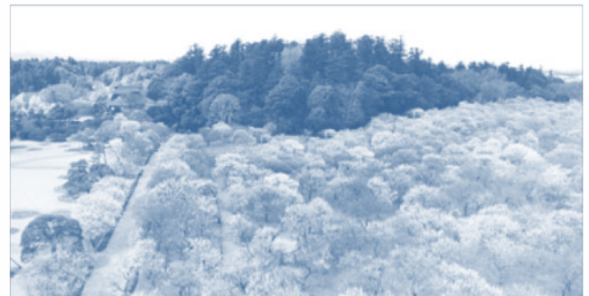
ดอกอุเมะ (ดอกบ๊วย) กว่าสามพันต้น ในเทศกาล ดอกบ๊วยมิโตะ ของสวนไครกาเอง จังหวัดอิบารากิ

สำหรับการเดินทาง ไม่ยากครับ เพราะเป็นสถานที่ท่องเที่ยวที่ฮิตอยู่แล้ว มีรถไฟด่วนออกทุกๆ ชั่วโมง เริ่มจากสถานีโตเกียว (東京駅: とうきょうえき: Toukyou eki) หรือสถานีอุเอโนะ (上野駅: うへのえき: Ueno eki) ก็ได้ครับสะดวกดี และนั่งรถไฟด่วนพิเศษของสาย JR โจบัง (JR常磐線: JRじょうばんせん: JR Joubansen) ขบวนด่วนพิเศษ ฮิตาจิ (ひたち: Hitachi) หรือโทกิวะ (とぎわ: Tokiwa) ก็ได้ครับไปลงที่สถานีมิโตะ (水戸駅: みとえき: Mito eki) และต่อรถเมลล์อิบารากิ โคซึอู (茨城交通: いばらきこうつう: Ibaraki Koutsuu) ไปอีกประมาณ 15 นาที