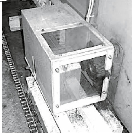
ที่โรงงานเคเคไอ

ทำฝาครอบของมอเตอร์ให้แข็งแรงโปร่งใส เพื่อให้เข้าใจถึงสภาพภายใน ไม่ต้องถอดฝาครอบก็เข้าใจได้ทันทีว่ามอเตอร์หมุนปกติหรือไม่