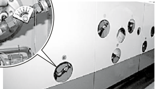
ผู้สนับสนุนด้านตัวอย่าง : บริษัท H C CREATION จำกัด

หากจะกล่าวถึง สิ่งที่ไม่สามารถมองเห็น แล้ว สภาพ ที่เกิดภายในเครื่องจักรหรืออุปกรณ์ก็เป็นสิ่งที่มองไม่เห็นเช่นกัน