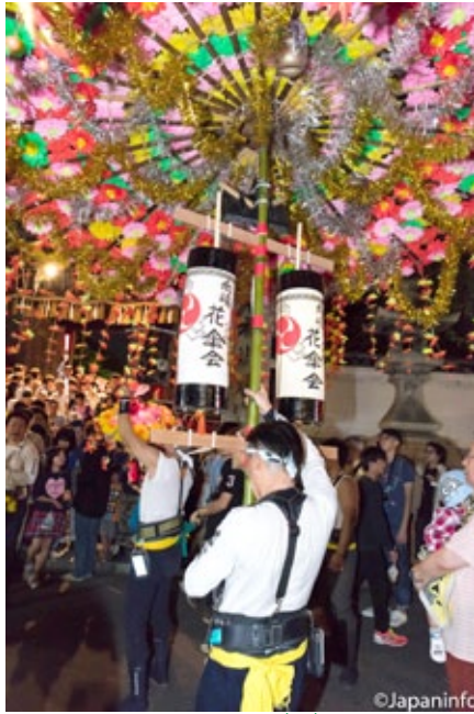
▲ ชายหนุ่มร่างกายกำยำลำสันเป็นคนแบกร่มไปกลับ