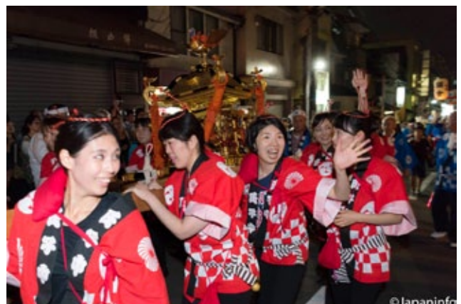
▲ บรรดาแม่ๆ เด็กก็ช่วยแห่เกี่ยวของตำบลนมาช่วยงานด้วย