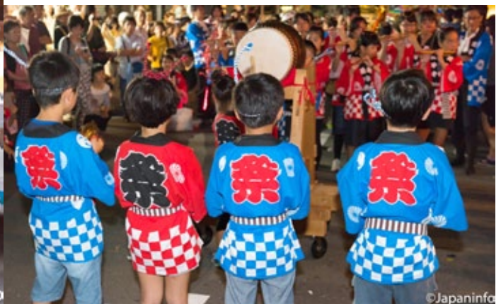
▲ เด็กๆ จากแต่ละกลุ่มพากันเล่นดนตรีไล่หลังร่วมของคณะตนตามมาติดๆ