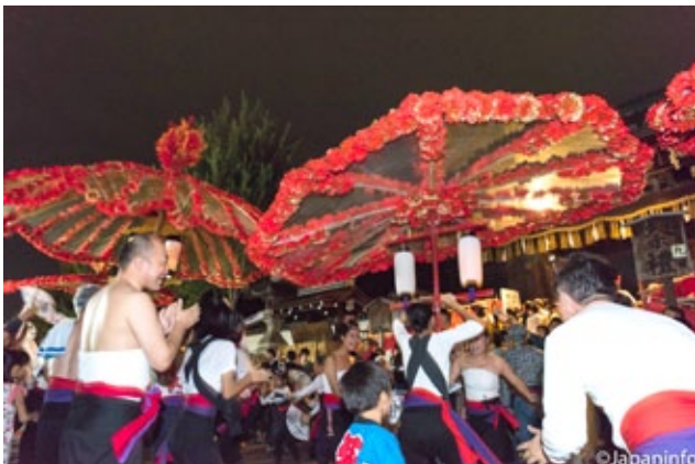
▲ ฮานะงะซะสีแดงใหญ่สามารถแยกออกเป็นร่มได้ 3-4 คัน กำลังถูกชูขึ้นหน้าประตูทางเข้าศาล

"อาถ" อุโนโยโยะ อาร่า อุโนโตะมาคาสะ" เมื่อหนุ่มร่างกายกำยำล่ำสันยกด้ามร่มยักษ์ขึ้นลงด้วยมือใหญ่ๆ สองมือ ปากก็ร้องให้จังหวะ "เฮ้า โซคิตี โซคิตี เฮ้า รับรองๆ" เด็กๆ ที่พากันแบกร่มเล็กประดับด้วยกระดาษสีระยิบระยับก็พากันร้องรับ "โฮโยโตะ โฮโยโตะ โฮโยโตะ" อย่างครื้นเครง บรรยายกาศงานช่างผิดกับเทศกาลดั้งเดิมส่วนใหญ่ของเกียวโตที่มักจะถูกขลังสง่างามมากทีเดียว