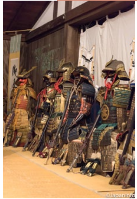
▲ ชุดนักรบที่ผู้ร่วมขบวนแห่จะสวมใส่

ปัจจุบันเทศกาลฮานะงาซะที่เขตฟุชิมินี้ประกอบไปด้วยร่วมยักษ์กว่า 20 คัน คันที่อลังการที่สุดเป็นร่วมสี่แดงซ้อนกันสามชั้น บางคณะก็ใช้ผู้หญิงแบก และแสดงผาดโผนเรียกเสียงปรบมือได้ไม่น้อยทีเดียว ขบวนแห่จะเริ่มจากเวลา 19.00-21.00 ในคืนวันแรก และคืนวันที่ 8 ของงาน โดยในเช้าวันที่ 9 ซึ่งเป็นวันสุดท้ายจะมีขบวนแห่เกี่ยวยักษ์สามองศ์ไปรอบตัวเขตฟุชิมิ หนึ่งในเกี่ยวดังกล่าวคือ "เกี่ยวเซนอิเมะมิโกะชิ" ที่อิเอะยาสุ ไชคุน ต้นตระกูลโทกุกาว่าสร้างถวายศาลเพื่อเฉลิมฉลองกำเนิดเจ้าหญิงเซน หลานสาว ว่ากันว่าเป็นเกี่ยวที่มีน้ำหนักราว 2,500 กิโลหนักที่สุดในญี่ปุ่น