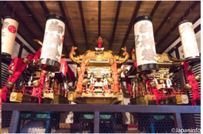
▲ เกี้ยวสามองค์ที่เตรียมไว้แห่ในเช้าวันสุดท้ายของงาน

ว่ากันว่าร่มฮานะงาซะนี้มีประวัติย้อนไปถึงสมัยมุโรมาจิ (ค.ศ.1336-1573) เดิมทีเป็นร่มผ้าขนาดใหญ่คล้ายกรดพระอุดงค์แต่ประดับดอกไม้รอบๆเรียกกันว่า "ฟูริวงาซะ" มาจากความเชื่อที่ว่าร่มสามารถแบกเอา "สิ่งไม่ดีไม่งาม" ไปได้ เมื่อห่มหรือขยับร่มขึ้นลง ความไม่ดีไม่งามก็จะหลุดพ้นไปเหลือแต่โชคลาภ ผู้คนจึงพากันประคองร่มเสมือนฝาก เอาความไม่ดีไม่งามไว้กับร่ม และก็จะบดมันออกไป ด้วยพลังของเทพเจ้า เดิมทีร่มฮานะงาซะ เป็นร่มที่ไม่ได้อลังการเช่นทุกวันนี้ แต่หลังจากที่บรรดาศิษยานุศิษย์ร่ำรวยจากการบ่ม และค้า เหล้าสาเกที่ผลิตได้จากน้ำบาดาลในเขตฟูชิมิ พวกเขาจะเริ่มประดิษฐ์ร่มให้งาม และใหญ่โตขึ้นพร้อมแห่ร่มไปสักการะเทพเจ้าประชันกัน เช่นทุกวันนี้