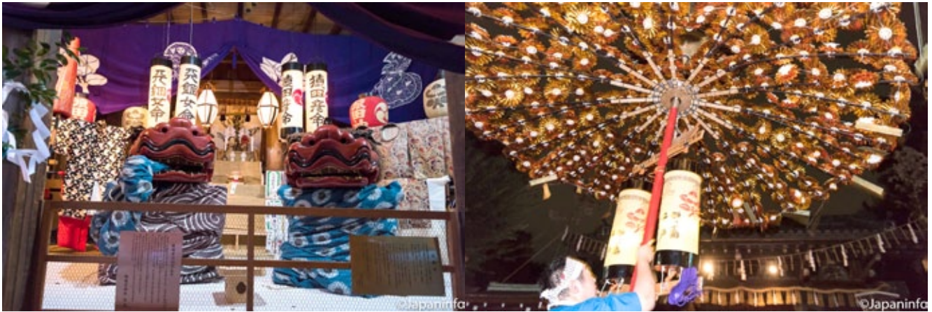
▲ หัวสิงโตก็นำมาเตรียมไว้พร้อม