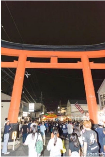
▲ ถนนหน้าสถานีรถไฟถึงประตูศาลแออัดไปด้วยผู้คนที่มาชมเทศกาล