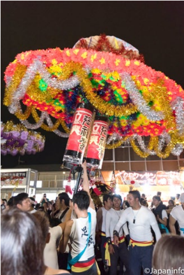
▲ หมูมๆ สนุกกันใหญ่ในคืนวันแห่ร่ม

เสียบปลายด้ามร่มไว้ในฝักร่มที่รอบเอน ใช้สองมือประคองนำร่มแห่ ออกเดินจากตำบลของตนมุ่งหน้าไปยังศาลโกะโคโนะมียา ระหว่างทางก็จะชูร่มขึ้นลงตามจังหวะกลอง และเสียงร้องของพรรคพวก และเมื่อมาถึงหน้าประตูศาลพวกเขาจะตั้งวงล้อมร่มคันใหญ่พากัน ร่ายรำไปมา ยิ่งเมื่อร่มถูกชูให้สูง ผาดโผนเท่าใด ดอกไม้ประดับ และ กระดิ่งรอบๆ ร่มก็จะปลิวไสวมีเสียงกรังกริ่งไพเราะ และเร้าใจ เรียกเสียงปรบมือจากผู้ชมรอบๆ ได้สนั่นขึ้น หลังคณะหนึ่งเสร็จการแสดงก็จะพากันแห่ร่มกลับไปตั้งในตำบลของตน เปิดทางให้อีกตำบลหนึ่ง มาเปิดแสดงเป็นเช่นนี้สลับกันไปตลอดค่ำวันแรก และค่ำวันสุดท้าย