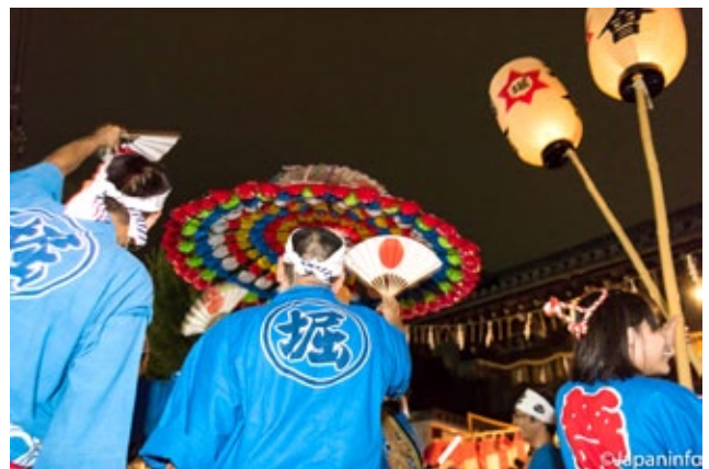
▲ พัดถูกใช้เป็นเครื่องมือส่งสัญญาณให้ขบวนขึ้นลงเป็นจังหวัด