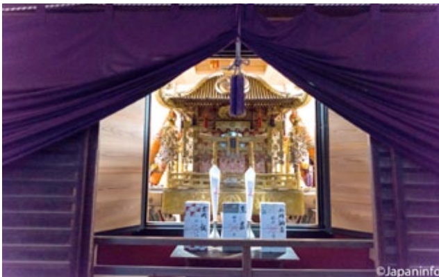
▲ เกี่ยวยักษ์ที่ Ieyau สั่งให้สร้างถวายเทพเจ้าเมื่อเจ้าหญิงเซนเกิด