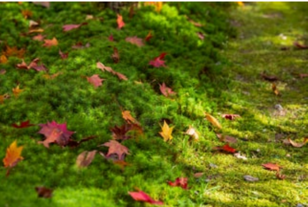
▲ หลังใบไม้โรยแล้วก็ยังมีงามบนพรมมอส