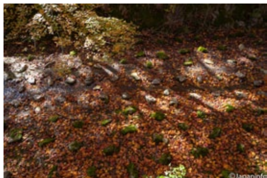
▲ โรยแล้วก็ยังงาม