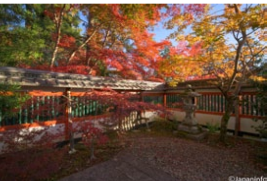
▲ ใบไม้ไล่สีกันงามที่ศาล Kuwayama-jinja เมือง Kameoka

และพร้อมๆ กับการย้ายเมืองหลวงจากนารามาเกียวโต ที่มีความแตกต่าง