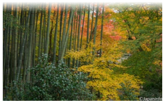
▲ ห่างจาก Shiseido มาราว 2-3 นาทีเป็นสวนงามของวัด Enkou-ji

หลังย่างเข้าเดือนธันวาคม ใบไม้เริ่มโรย และแห่งกรอบกันไปตามๆ อากาศก็เริ่มหนาว สะท้อน อย่างไรก็ตามแต่จะออกไปเดินยามเช้าเลย หลายคนยังแทบจะพาตัวเองออกมาจากใต้ผ้าห่มอุ่นๆ ไม่ได้ หากไม่มีฤดูใบไม้ร่วงที่งดงาม อุณหภูมิลดลงเข้าสู่ฤดูหนาวทันทีเลย ผู้คนคงห่อหุ้มและอาจไม่สามารถทนความหนาวที่ยาวนานได้ ฤดูใบไม้ร่วงและการล่าใบไม้จึงเป็นเสมือนความบันเทิงที่เทพเจ้าประทานให้พวกเขาช่วงสั้นๆ ท่านที่อยากทราบว่าฤดูใบไม้ร่วงในญี่ปุ่นงดงามเพียงใดลองแวะมาที่เกียวโตช่วงกลาง ถึงปลายเดือนพฤศจิกายนกันสักครั้งนะค่ะ