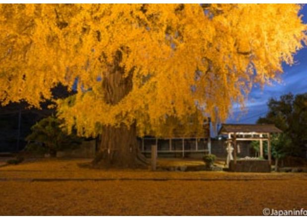
▲ Oicho อายุ 300 ปีที่ตำบล Katsuragi-cho จังหวัดวาคายาม่า