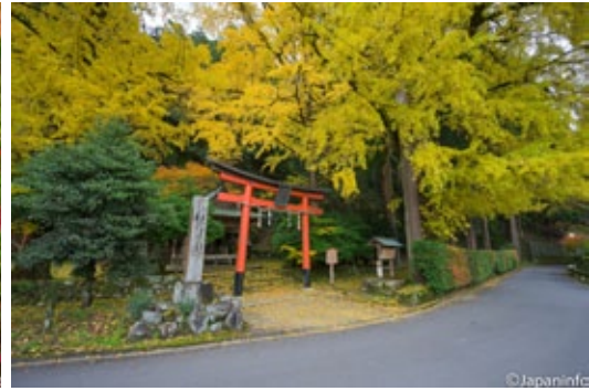
▲ สวน Shisendo สร้างโดย Ishikawa Jo-zan เสียงกาลักน้ำเพราะก้องสวน