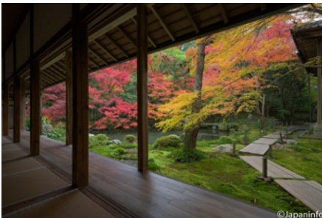
▲ สวนน้ำของวัด Renge-ji ถ่ายให้เห็นเหมือนอยู่ในกรอบรูป (Gakubuchi-teien) ย่าน Yase ในเกียวโต

การชมใบไม้เปลี่ยนสีสำหรับคนญี่ปุ่นนั้น เป็นธรรมเนียมเก่าแก่ที่เริ่มกันมาตั้งแต่ดึกดำบรรพ์ จากหลักฐานใน "มันโยชู" (ที่รวบรวมบทเพลงสั้นกว่า 4,500 เพลง เป็นหนังสือรวม 20 เล่ม เชื่อกันว่าถูกรวบรวมขึ้นในสมัยปลายนารา ราวปี ค.ศ.783) พบคำว่า "โมะมิจิ" ราวกว่าหนึ่งร้อยบทเพลง หนึ่งในบทเพลงที่เป็นที่รู้จักกันแพร่หลาย ประพันธ์โดยเจ้าชายโฮะซุมิ พระราชโอรสองค์ที่ 5 ของจักรพรรดิเทมมุ (สวรรคตเมื่อปี 715) มีเนื้อความว่า