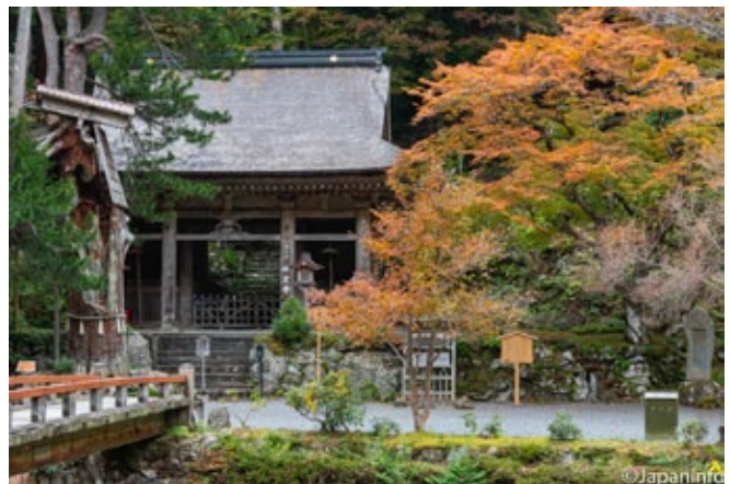
▲ เมเปิ้ลสีออกส้มๆ ที่วัด Bujou-ji ทางเหนือสุดของเกียวโต