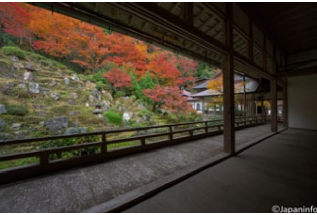
▲ สวนงามของวัด Joushokou-ji ทางเหนือของเกียวโต