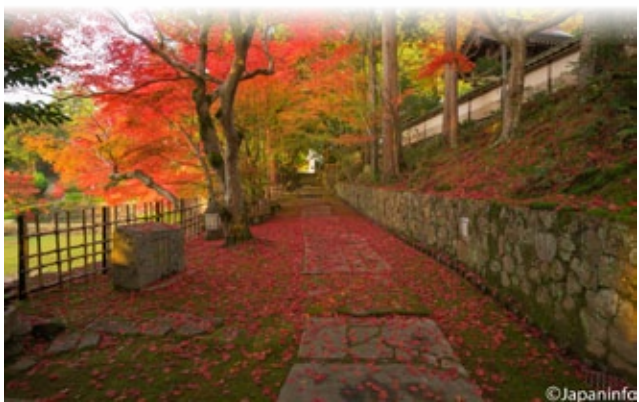
▲ ชมใบไม้ที่วัด Myosho-ji ปีนี้ดังมามาก

ทุกวันนี้ คนญี่ปุ่นยังคงพยายามค้นหาแหล่งชมใบไม้งามๆ ที่ตนโปรดปรานกันทั่วทุกหนทุกแห่ง ยิ่งเมื่อ SNS เป็นที่แพร่หลายช่างภาพสมัครเล่นรวมทั้งผู้เขียนกับเพื่อนๆ ช่างภาพคนญี่ปุ่น ก็พากันออกล่า ออกค้นหาที่ชมใบไม้ที่คนไม่แออัด สีสด มีหมอกยามเช้ากัน