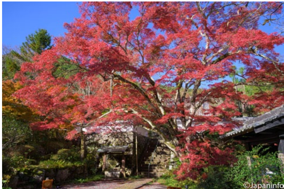
▲ เมเปิ้ลอายุ 400 ปีที่วัด Jinzou-ji

“เคชะโนะ อาซะเคะคาริระ เนะคิชิทสุ คาสุงะ ยามะโมะมิจิ นิ เคะราชิ วาเง โคะโคะโละ อิตาชิ” “รุ่งเช้าวันนี้ได้ยินเสียงร้องของนกเปิดน้ำ เพียงนี้ก็รู้ว่าขุนเขาคาสุงะคงเปลี่ยนเป็นสี เหลืองอร่ามก็อดเปล่าเปลี่ยวใจไม่ได้”