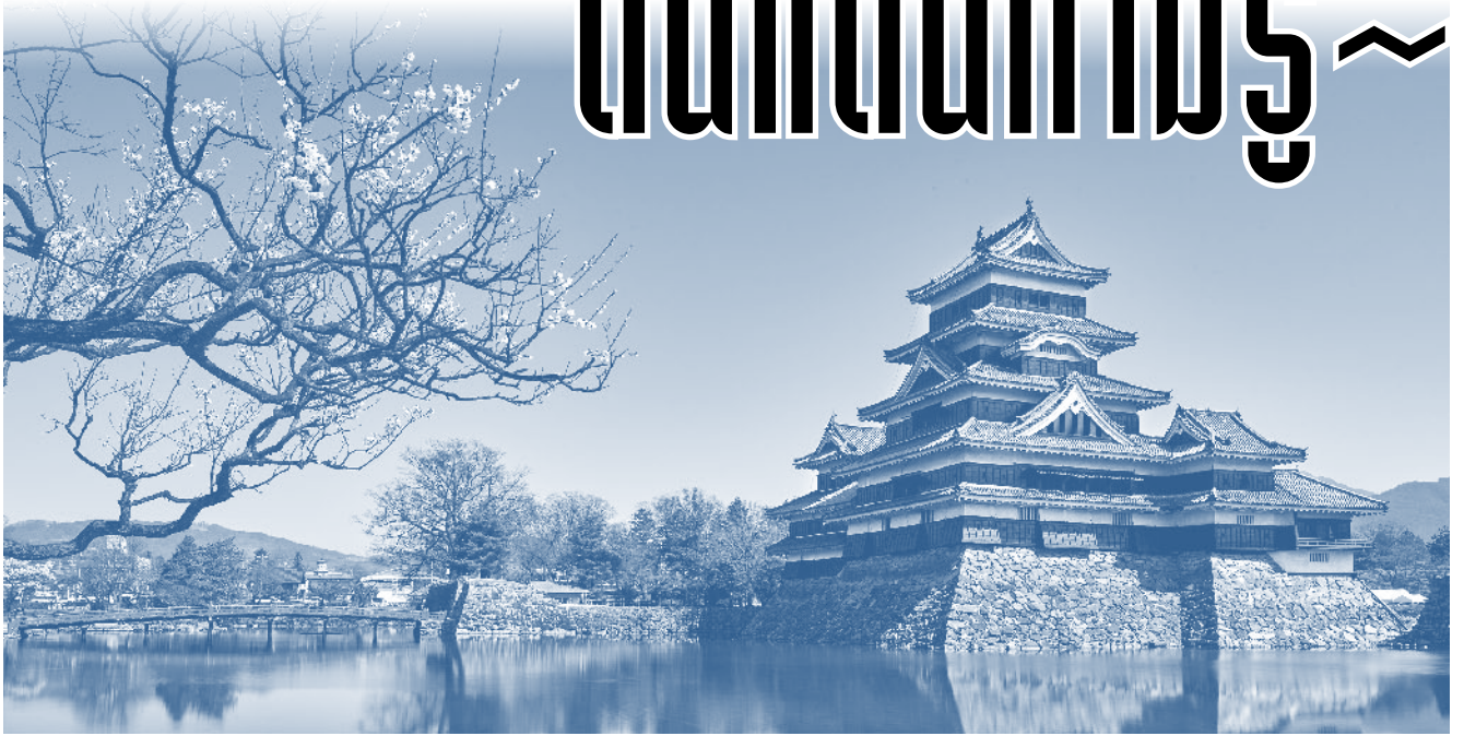
อาศิษฐ์ ติ่มนวล สำนักพิมพ์ภาษาและวัฒนธรรม อ.ล.ก.

พอ พูดถึง “นาโงย่า” เชื่อว่าเราๆ ท่านๆ ก็ต้องเคยได้ยินชื่อกันแหละ แต่ถ้าถามว่าที่นั่นมีอะไรเที่ยว ก็เชื่อว่าหลายคนจะตอบไม่ได้ รวมถึงข้าพเจ้าด้วย นาโงย่าเป็นเมืองที่อยู่ทางภาคกลางของญี่ปุ่น (中部 中部) ปกติคนที่ท่องเที่ยวญี่ปุ่นแบบข้ามภูมิภาคก็จะวิ่งจากทางฝั่งคันไซมาทางคันโต ไม่ก็ทางคันโตไปทางคันไซ หรือก็ขึ้นเหนือสุด (ฮอกไกโด) ลงใต้สุด (ฟูคูโอกะ) กันไปเลย แล้วก็ผ่านภาคกลางที่วันนี้ไปโดยไม่ทันรู้ตัว และนี่จะเป็นครั้งแรกของคณะทัวร์ขนาดจิวที่สโปกาสจะได้ไปสัมผัสดินแดนที่ไม่รู้แห่งนี้กัน