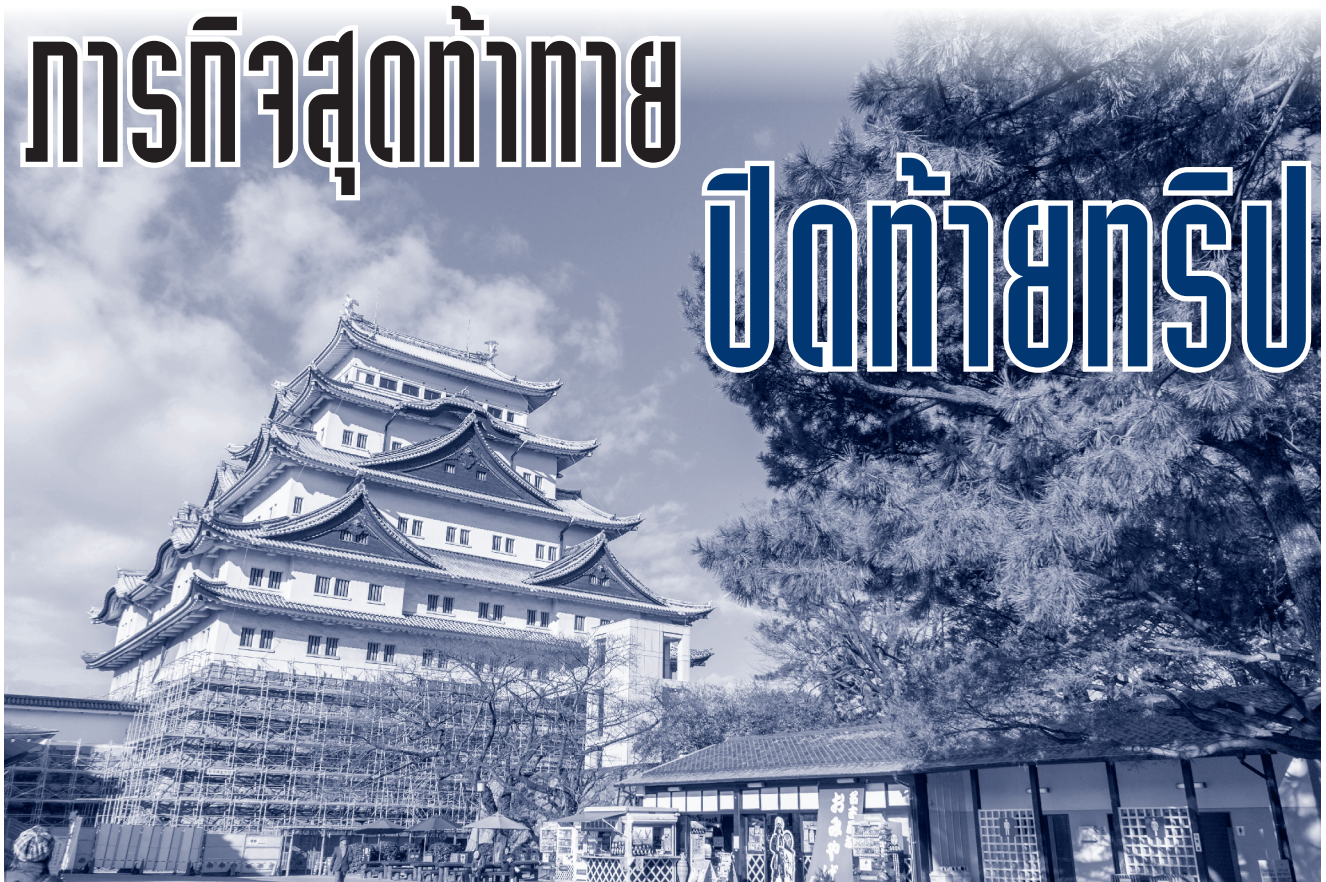
อาทิตย์ นิ่มนวล สำนักพิมพ์เกษมและวัฒนธรรม ส.ส.ก.

ถ้า ใครที่ติดตามกันมาตั้งแต่ EP แรกๆ ก็น่าจะสังเกตว่า จนปานนี้ ข้าพเจ้า และเดอะแก๊งยังไม่เจอเป้าหมายที่แท้จริงของการมาที่นาโกย่าเลย และวันนี้ก็ถึงฤกษ์งามยามดีได้เวลาเปิดตัวจนได้ ด้วยความที่การสื่อสารค่อนข้างจำกัด ไม่รู้ว่าอีกฝ่ายจะถนอมปากถนอมคำไปถึงไหน เวลาจะนัดแนะพิกัดที่จะมาเจอกันก็เลยติดๆ ขัดๆ แทบจะไม่รู้เรื่อง ขอเล่าย้อนความไปว่า เมื่อครั้งที่เจ้าตัวได้รับมอบหมายจากที่บริษัทให้มาศึกษาดูงานที่นี่ ก็ได้ตั้งปณิธานอันแน่วแน่ว่าจะเก็บเงิน จะใช้เงินน้อยๆ (เพราะทางนี้เขาให้เบี่ยเลี้ยงด้วย) ใช้เท่าที่จำเป็น ฉะนั้น การจะสื่อสารกันว่า มาเจอกันตรงนี้นะ เดินเข้ามาในสถานีแล้วจะเจอนั้นนี่ คือแทบจะไม่รู้เรื่องเลย เพราะคนของเราดำรงชีวิตอยู่แต่ในห้องพักของโรงงาน จะออกมาดูโลกภายนอกก็แค่ปั่นจักรยานแหวกอากาศหนาวไปซื้อของมาประทังชีวิตที่ซูเปอร์เล็กๆ โกลัๆ แค่นั้น เพื่อนๆ ในไซต์งานชวนไปไหนไม่ไป ไปก็ไปแบบแแกนๆ ไม่อินกับอะไรทั้งสิ้น อินเทอร์เน็ทมีใช้นะ แต่เป็นแบบซิมโทรศัพท์ แถมยังต้องแชร์กับเพื่อนร่วมห้องอีก... มาลองทายกันเล่นๆ ว่าการมาศึกษาดูงานครั้งนี้เขาจะได้อะไรกลับไปบ้างไหมครับ