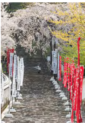
▲ ซากุระบานสะพรั่ง