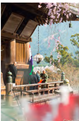
▲ พระสงฆ์ช่วยกันเปลี่ยนม่าน