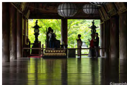
▲ Reido หน้าร้อน สีเขียวของใบไม้สะท้อนบนพื้นงดงาม