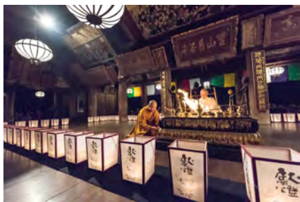
▲ พิธีสดโฮมา