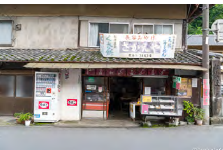
▲ ร้านค้าริมทาง

ถูกประคานับเป็นพระโพธิสัตว์ไม้ในทำย่นที่ใหญ่ที่สุดในญี่ปุ่น ปัจจุบันองค์พระโพธิสัตว์ไม้เนี้ก็ยังมีประดิษฐานในโบสถ์ไม้บนเนินเขา เปิดให้ผู้มีจิตศรัทธาได้เข้าไปนมัสการใกล้ชิดเป็นประจำ แม้ผู้เขียนจะไม่เคยออกแสวงบุญเช่นพุทธศาสนิกชนญี่ปุ่นที่ศรัทธาในพระโพธิสัตว์โดยก็ตาม แต่ในบรรดาวัดทั้ง 33 แห่ง ที่อยู่ในบัญชีนั้น ก็เคยมีโอกาสไปนมัสการมาแล้วกว่า 20 แห่งด้วยกัน โดยเฉพาะวัดฮาเซเดระซึ่งถูกระบุให้เป็นวัดที่ 8 ของเส้นทางแสวงบุญนั้น ไปเยือนมากกว่า 15 ครั้งได้ ต้องบอกตามตรงเลยว่าทั้งหลงใหลในความงามของธรรมชาติที่หอมล้อมไปด้วยขุนเขา ต้นไม้ดอกไม้ประจำฤดูกาล สถาปัตยกรรมอันงดงาม ความเงียบสงบที่หาไม่ได้ตามวัดท่องเที่ยวต่างๆ ที่คนไทยมักไปเยือนกัน และเหนืออื่นใด ร่องรอยของพุทธศาสนาที่สัมผัสได้จากพระสงฆ์ที่ออกทำวัตรทุกวัน รวมไปถึงพิธีกรรมต่างๆ ที่ไม่เหมือนใคร