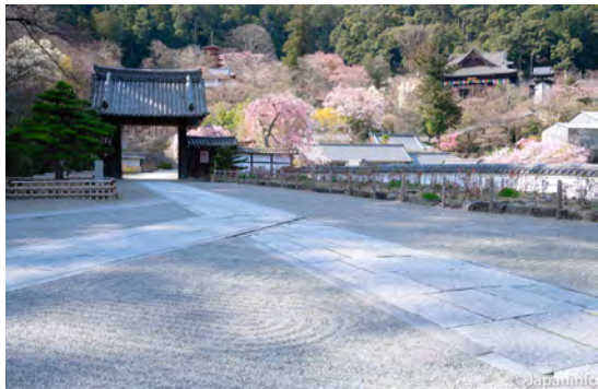
▲ จากกุฎิเจ้าอาวาสด้านล่างมองเห็นโบสถ์ด้านบนท่ามกลางซากุระ