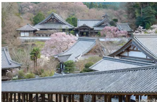
▲ สถาปัตยกรรมที่เป็นเอกลักษณ์