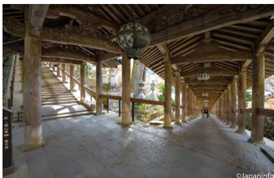
▲ ช่วงรอยต่อระหว่างบันไดชั้นล่างกับชั้นกลาง