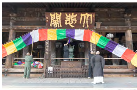
▲ เปลี่ยนผ้า 5 สีสัญลักษณ์พระโพธิสัตว์ 5 องค์