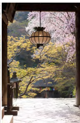
▲ แสงแดดบามบ่าย