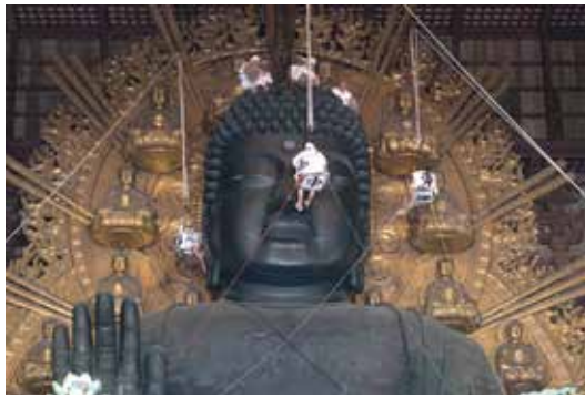
▲ พิธีโอมินูงุ่ทำความสะอาดองค์พระ จัดขึ้นทุก วันที่ 7 สิงหาคม