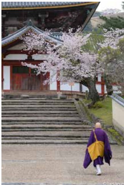
▲ พระสงฆ์กำลังเดินไปทำวัตรเช้าจากกุฏิใกล้ๆ โบสถ์ Todaiji