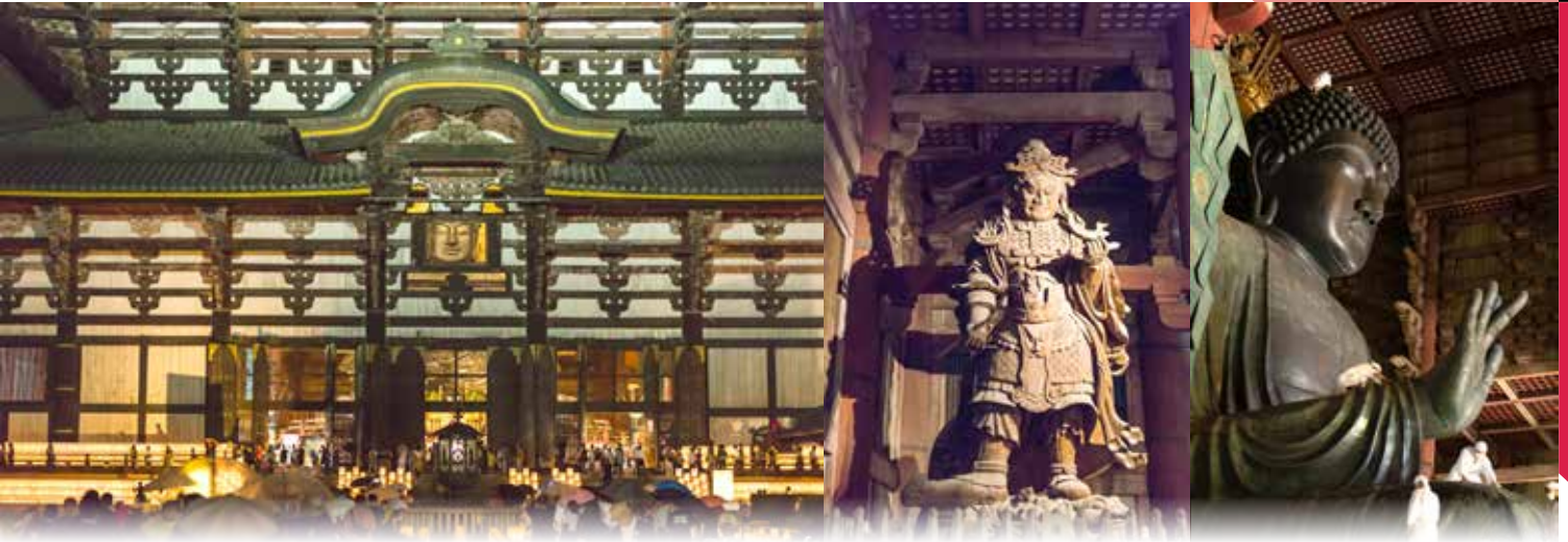
▲ หน้าต่างโบสถ์ไดบุตสึแดงเปิดเฉพาะวันที่ 15 สิงหาคม