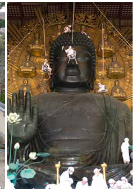
▲ พระสงฆ์ และศิษยานุศิษย์ในชุดขาวราว 200 คนช่วยกันปิดฝุ่นองค์พระ และโบสถ์