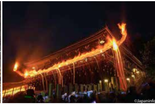
▲ พิธีซุนิเอะมีการยกคบเพลิงไหม้ทศจากด้านล่าง ขึ้นไปบนระเบียงวิหาร นิงุ่ทศโต ถือเป็นพิธีที่ปฏิบัติกันต่อเนื่องทุกปี ตั้งแต่ตั้งวัดโทไดจิ

ก็มักพบกับนักท่องเที่ยวจากทั่วโลก กระจายกันอยู่เต็มพื้นที่ ตั้งแต่หน้าทางเข้า ร้านข้าวเกรียบของกวาง สอนสาธารณะนารา ไปจนถึงในตัวโบสถ์ และกุฏิวิหารที่เรียงรายอยู่โดยรอบ ว่ากันว่านักท่องเที่ยวจากยุโรป มักให้ความสนใจกับสถาปัตยกรรมไม้อันใหญ่โตของที่นี่ เพราะยุโรปมีแต่ปราสาทหิน ในขณะที่นักท่องเที่ยวจากเอเชีย โดยเฉพาะจีนมักสนุกกับการให้อาหารกวางที่ถูกปล่อยให้เดินไปมาตามธรรมชาติกว่า 1,300 ตัว และไม่ว่านักท่องเที่ยวจะมาจากที่ใด ทุกคน ก็จะตื่นเต้นกับความอลังการของทั้งตัววัด และองค์พระประธานที่มีประวัติย้อนไปถึงศตวรรษที่ 7-8