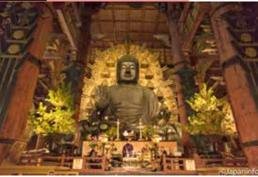
▲ พระสงฆ์กำลังสวดถวายพระไวโรจน พุทธะในค่ำวันที่ 15 สิงหาคม