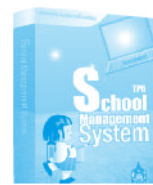
ระบบบริหารจัดการโรงเรียนอย่างครบวงจร