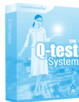
ระบบทดสอบออนไลน์ รองรับทั้ง Internet และ Intranet ใช้ในการวัดระดับขีดความสามารถของบุคลากร

ติดต่อสอบถามข้อมูลเพิ่มเติมได้ที่ ฝ่ายพัฒนาธุรกิจและเทคโนโลยีเว็บ ส.ส.ท. เราอาจจะมี Solution หรือบริการตามที่คุณวางแผนไว้อยู่แล้วก็ได้ โทร. 0 2717 3000 ต่อ 524 หรือ www.tpa.or.th , www.ThaiJapanMarket.com , www.tpa.or.th/industry