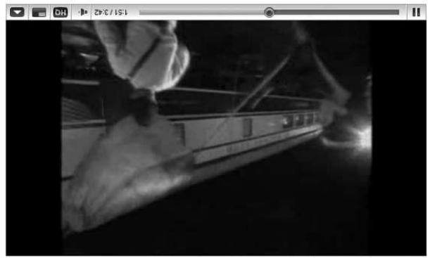
David Copperfield part 1/17 Orient Express

แต่ในหนังสือเวทย์มนต์ของ David Copperfield... (The text is mirrored and mostly illegible due to low resolution and orientation.)