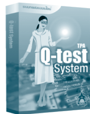
ระบบทดสอบออนไลน์ รองรับทั้ง Internet และ Intranet ใช้ในการวัดระดับขีดความสามารถของบุคลากร

ติดต่อสอบถามข้อมูลเพิ่มเติมที่ฝ่ายพัฒนาธุรกิจและเทคโนโลยีเว็บ ส.ส.ท. เราอาจจะมี Solution หรือบริการตามที่คุณวางแผนไว้อยู่แล้วก็ได้ โทรศัพท์ 0 2717 3000 ต่อ 524 หรือ www.tpa.or.th , www.ThaiJapanMarket.com , www.tpa.or.th/industry