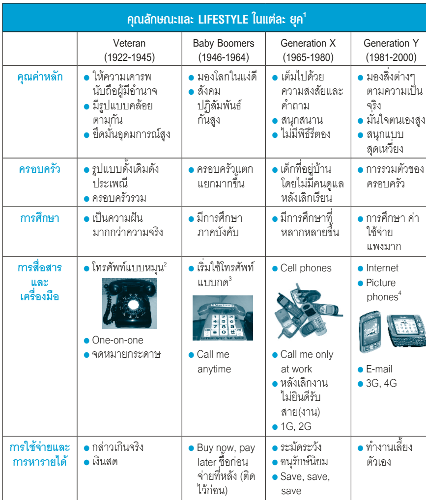
คุณลักษณะและ LIFESTYLE ในแต่ละ ยุค 1

ฉบับ นี้มาทำความรู้จักกับ Hybrid Customer กัน ดังนั้น ขอขย้อณยุคสักนิดเพื่อให้รู้จักคนแต่ละยุคได้มากขึ้น เพราะคนแต่ละยุคก็จะเปลี่ยนแปลงไปโดยปัจจัยหลายๆอย่าง รวมทั้งปัจจัยที่เรียกว่าเทคโนโลยี