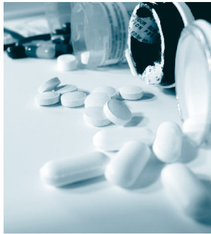
โดยไม่ได้คิด

เข้ากับหน่วยงานตัวเองก็จะทำให้สถาบันสามารถเร่งความเร็วของการสร้างระบบได้อย่างรวดเร็วขึ้นมาได้และประโยชน์อีกอย่างหนึ่งที่ผู้เขียนรู้สึกได้ว่า การสร้างระบบ หรือพัฒนาระบบให้เป็นมาตรฐาน ตัวบ่งชี้ที่กำหนดนั้นมีสิ่งทีเตือนใจเราให้สนใจในสิ่งที่เราไม่เคยสนใจตัวบ่งชี้ต่างๆ ที่กำหนดขึ้นในระบบ โดยส่วนใหญ่ก็ศึกษามาจาก Know How ของผู้ทรงคุณวุฒิหลายๆ ท่าน หากมีการระบุให้เรากระทำ ย่อมต้องมีสาเหตุที่เราต้องคิด แม้อาจจะไม่เหมาะกับสถาบันของเรา แต่ก็ทำให้เราหยุดคิดสักนิดคิดว่าปล่อยให้ผ่านเลยไป