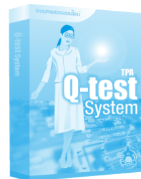
ระบบทดสอบออนไลน์ รองรับทั้ง Internet และ Intranet ใช้ในการวัดระดับขีดความสามารถของบุคลากร

ติดต่อสอบถามข้อมูลเพิ่มเติมได้ที่ ฝ่ายพัฒนาธุรกิจและเทคโนโลยีเว็บ ส.ส.ท. เราอาจจะมี Solution หรือบริการตามที่คุณวางแผนไว้อยู่แล้วก็ได้ โทรศัพท์ 0 2717 3000 ต่อ 524 หรือ www.tpa.or.th , www.ThaiJapanMarket.com , www.tpa.or.th/industry