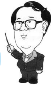
วิฑูรย์ สิงโศคติ ปลัดกระทรวงอุตสาหกรรม