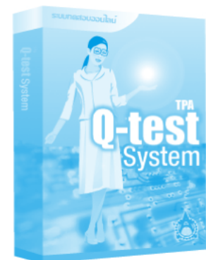
ระบบทดสอบออนไลน์ รองรับทั้ง Internet และ Intranet ใช้ในการวัดระดับขีดความสามารถของบุคลากร

ติดต่อสอบถามข้อมูลเพิ่มเติมที่ฝ่ายพัฒนาธุรกิจและเทคโนโลยีเว็บ ส.ส.ท. เราอาจจะมี Solution หรือบริการตามที่คุณวางแผนไว้อยู่แล้วก็ได้ โทรศัพท์ 0 2717 3000 ต่อ 524 หรือ www.tpa.or.th , www.ThaiJapanMarket.com , www.tpa.or.th/industry