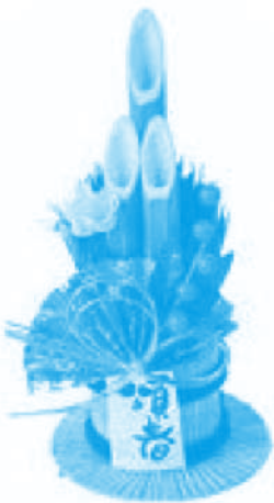
คาโดมาชิ