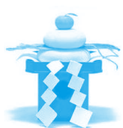
คามิโมจิ