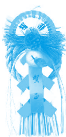
ชิมะคาซาริ