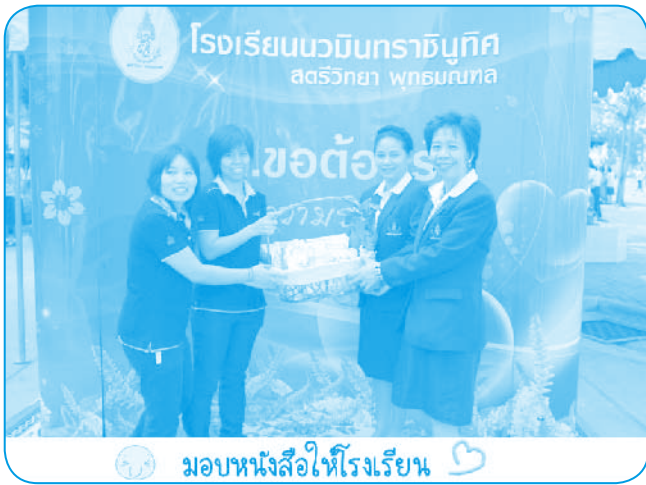
มอบหนังสือให้โรงเรียน