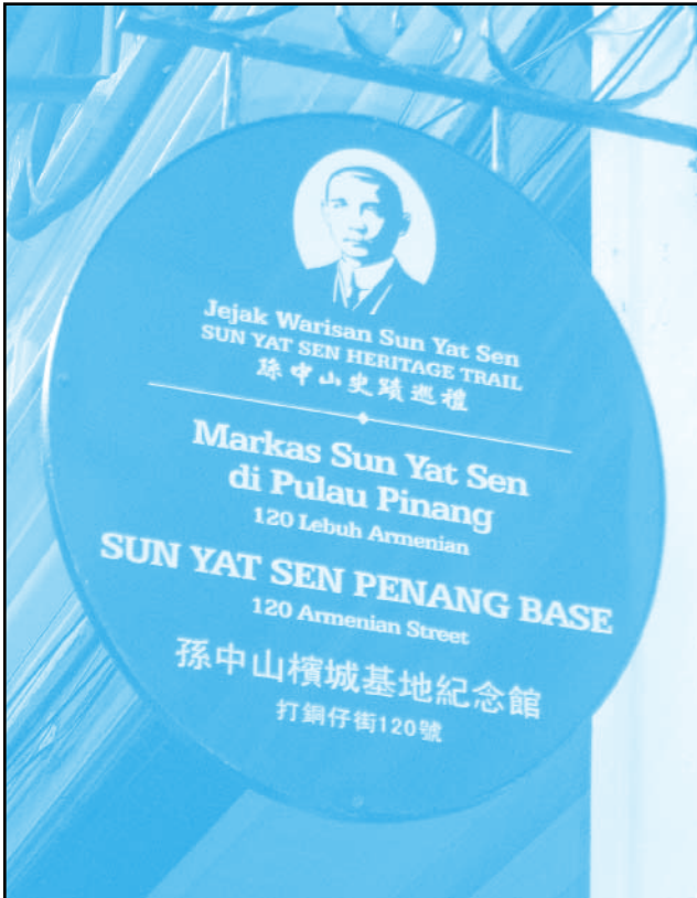
SUN YAT SEN Penang Base

WU กับตอนต่อของเราพาท่านผู้อ่านไปเที่ยวปีนังกัน ฉบับที่แล้วได้แนะนำประวัติศาสตร์ของเกาะนี้และย่านเมืองเก่าของเมือง Georgetown ที่ได้รับการรับรองเป็นมรดกโลก ฉบับนี้เรามารู้จักสถานที่สำคัญๆ ที่นักท่องเที่ยวเวลาจำกัดไม่ควรพลาดกันสัก 2 แห่ง