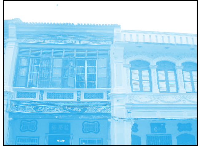
(Left) Old Heritage House Where Penang Conference was held

เช่นเดียวกับเศรษฐีชาวจีนหลายท่านในอดีต มีสเตอร์ของมีภรรยาถึง 7 คนและมีลูกหลานมากมาย กุศโลบายที่น่าทึ่งของเขาในการรักษามรดกให้อยู่กับวงศ์ตระกูลให้ยาวนานที่สุด เล่ากันว่าเขาทำพิธีกรรมสั่งห้ามขายคฤหาสน์หลังนี้จนกว่าบุตรคนสุดท้ายของเขา (ซึ่งน่าจะเกิดจากภรรยาคนที่ 7) จะอายุ 70 ปี และแล้ววันนั้นก็มาถึงเมื่อลูกหลานของเขาตัดสินใจขายคฤหาสน์หลังนี้แล้วแบ่งทรัพย์สินสมบัติแยกย้ายกันไปอยู่ในประเทศสิงคโปร์บ้าง ออสเตรเลียบ้าง นำเสียดายจริงๆ แต่อย่างน้อยรัฐบาลได้เป็นผู้ครอบครองดูแลในที่สุด ในปี 1990 และบูรณะ (Restoration Work) อย่างจริงจังให้เป็นสถานที่ประวัติศาสตร์และท่องเที่ยวแห่งหนึ่ง จนได้รับรางวัล UNESCO Heritage Award ในปี 2000