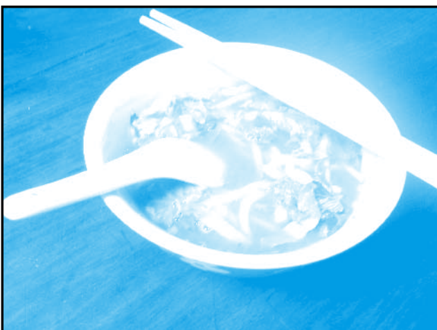
Laksa Penang Style