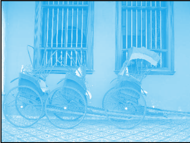
Old Trishaw in front of the Blue House