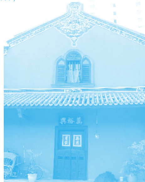
The Stunning blue Colour of the Blue Mansion

การค้าของเขาประสบความสำเร็จอย่างสูงและสร้างความมั่งคั่งให้เขาจนขึ้นแท่นหนึ่งในมหาเศรษฐีของยุคนั้นและได้รับการขนานนามว่า Rockefeller of the East เมื่อเขาเสียชีวิตในปี ค.ศ. 1916 (...95 ปีมาแล้ว) กล่าวกันว่ารัฐบาลท้องถิ่นของอังกฤษในยุคนั้นยัง ลดธงครึ่งเสา (half mast) เป็นการ ไว้อาลัย (to pay tribute / to pay respect)