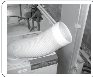
ไม่รู้เอาเครื่องปรับอากาศทำงานอยู่หรือเปล่า