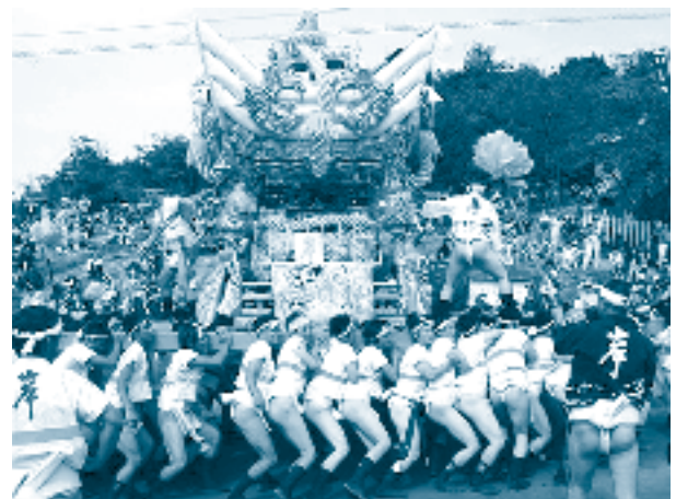
ภาพบรรยากาศงานเทศกาลฤดูใบไม้ร่วง