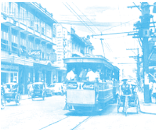
รถรางในกรุงเทพมหานคร

เมื่อพูดถึงรถราง บางท่านที่เป็นคนรุ่นใหม่อาจจะนึกไม่ออกว่ารถราง คือ รถประเภทไหน รถราง (Tram) คือพาหนะที่วิ่งบนราง มีลักษณะคล้ายกับรถไฟ แต่ตัวรถจะสั้นกว่าและน้ำหนักเบากว่าและวิ่งบนพื้นถนน การขับเคลื่อนโดยส่วนใหญ่จะใช้ไฟฟ้าจากสายไฟด้านบน ในอดีตประเทศไทยก็เคยมีการใช้รถรางเช่นเดียวกัน โดยวิ่งในใจกลางเมืองกรุงเทพมหานครเป็นหลัก (มีทั้งหมด 7 สาย) ในช่วงประมาณปีพ.ศ.2431-2511