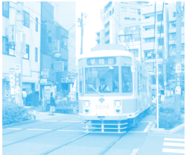
แม้แต่ในเมืองหลวงที่การจราจรคับคั่งและแสนวุ่นวายอย่างโตเกียว ก็ยังมีรถรางวิ่งอยู่