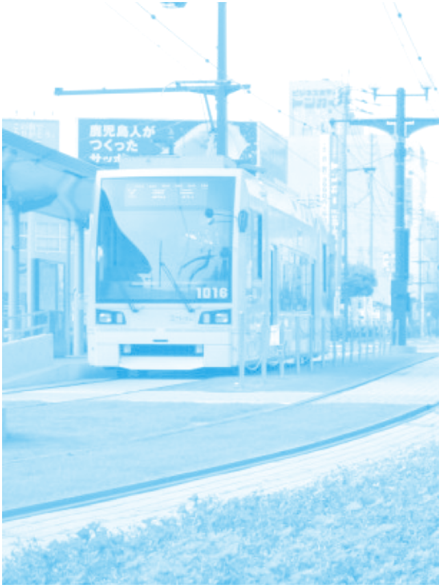
รถรางที่วิ่งในตัวเมืองคะงะชิมะ ตัวรถเป็นรถรุ่นใหม่ พร้อมทิวทัศน์รอบข้างที่สวยงามเป็นมิตรต่อสิ่งแวดล้อม