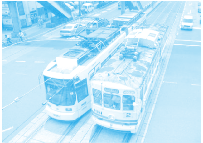
รถรางรุ่นเก่าและรุ่นใหม่ที่จะวิ่งสวนกันในเมืองคุมะโอะโตะ