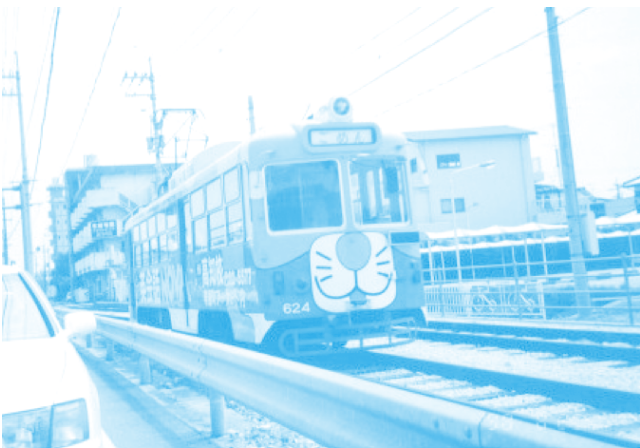
รถรางในเมืองโคจิ ที่แต่งให้ดูน่ารัก เรียกรอยยิ้มจากผู้พบเห็นได้