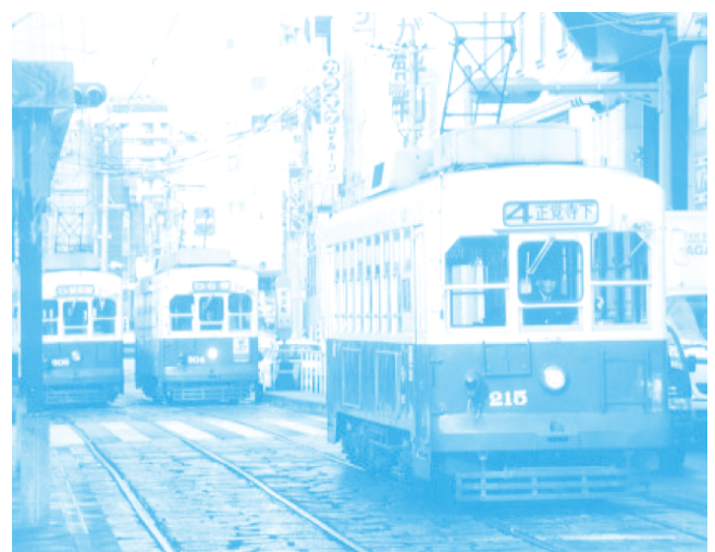
รถรางที่วิ่งในตัวเมืองนะงะซะกิ ตัวรถเป็นรถรุ่นเก่า

ถึงแม้ว่าผู้เขียนจะไม่เคยใช้บริการรถรางของกรุงเทพมหานคร แต่ในช่วงที่ผู้เขียนได้ไปศึกษาที่ประเทศญี่ปุ่น (เมืองโอริซึมา) ก็ได้เคยใช้บริการรถรางของที่นี่ รู้สึกได้ถึงความคลาสสิกและได้บรรยากาศของเมืองที่มีความเจริญมาในยุคก่อนหน้า รถรางของญี่ปุ่น (Roman densha, Chin-chin densha) ก็ยังคงให้บริการตามหัวเมืองต่างๆ ของประเทศญี่ปุ่นตั้งแต่ตอนเหนือสุด (ฮอกไกโด) ไปจนถึงใต้สุด (คะโงะชิมะ)