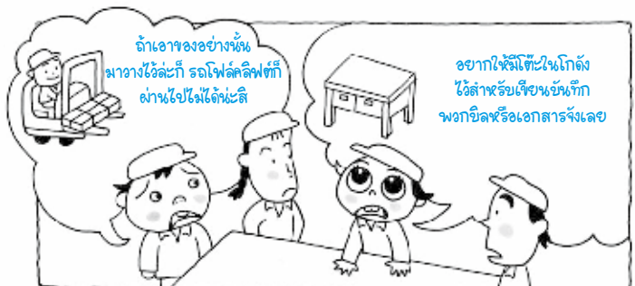
สิ่งที่ทำคือ ขั้นแรกไปโกดังแล้วลองหาที่วางโต๊ะกัน

ไคเซ็น ② หลังจากนั้นได้ทำการติดตั้งหลอดไฟเล็กแบบเฉพาะจุดไว้ที่เสา แค่นี้บริเวณที่เขียนก็สว่างแล้ว ในที่สุดการเขียนบันทึกบิลเอกสารต่าง ๆ ในโกดังที่เคยลำบากมาตลอด ก็ถูกแก้ไขให้สบายขึ้นด้วยการใช้โต๊ะดังกล่าว ขั้นแรกที่สุดคือ ต้องลองทำดูก่อน ถ้าปัญหายังคงเหลืออยู่ก็ทำไคเซ็นต่อไปอีกเท่านั้นเอง