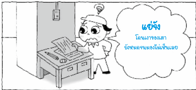
เพิ่งรู้สึกตัว เมื่อได้ลองทำแล้ว