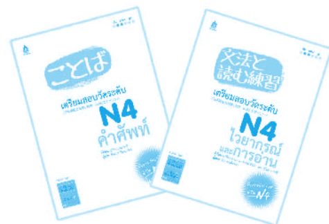
ชุด เตรียมสอบวัดระดับ N4