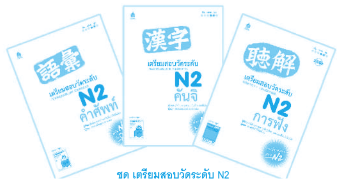
ชุด เตรียมสอบวัดระดับ N2