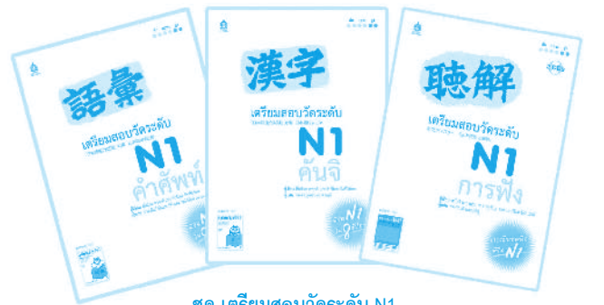
ชุด เตรียมสอบวัดระดับ N1