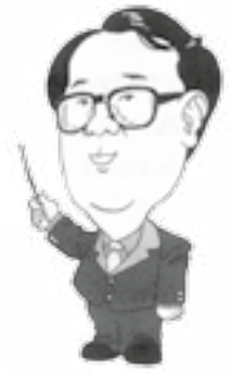
ดร.วิฑูรย์ สิมะโชคดี ปลัดกระทรวงอุตสาหกรรม

“อุตสาหกรรมสีเขียว” (Green Industry) เกิดจากความมุ่งมั่นของเรา (ประเทศไทย) โดยแท้ จุดเริ่มต้นเกิดจากการที่ประเทศไทยมุ่งสู่ “การพัฒนาที่ยั่งยืน” (Sustainable Development) ตามที่ได้ให้สัตยาบันรับรองปฏิญญาโจฮันเนสเบิร์ก เมื่อปี 2545 และปฏิญญามะนิลาว่าด้วยอุตสาหกรรมสีเขียว เมื่อปี 2552