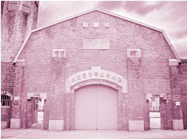
“เรือนจำชอแดมุน 서대문 형무소 (ชอแดมุน ฮยองมูโซ) หรือ Seodaemun Prison History Hall”