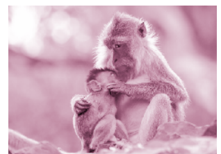
▲ รูปที่ 16 ลิง

ปากกจับขึ้นงาน อุปกรณ์ชิ้นนี้เป็นตัวใช้ยึดจับวัสดุต่างๆ ที่ต้องการ เพื่อใช้ในการทำงานต่อไป ไม่ว่าจะเป็นการตะไบ เชื่อม ยึดติด ทาสี ฯลฯ ที่ต้องมีคำว่า “จับขึ้นงาน” พ่วงท้ายอยู่ด้วยคงจะเกรงว่าจะสับสนกับคำว่าปากกาที่หมายถึงอุปกรณ์ที่ใช้สำหรับขีดเขียนไปตามโครงการก่อสร้างก็สามารถพบเห็นได้ทั่วไปครับ ส่วนใหญ่จะยึดติดกับโต๊ะทำงานอยู่ในส่วน workshop เตรียมอุปกรณ์ให้พร้อมเพื่อนำไปติดตั้งต่อไป