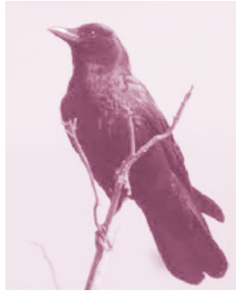
▲ รูปที่ 18 ม

คีมปากจิ้งจก เป็นคีมชนิดหนึ่งที่มีลักษณะหัวปลายเรียวยาวประมาณปากของจิ้งจกเลยครับ สำหรับใช้งานหยิบจับ หรือตัดลวดก็ได้ ในกรณีที่ขนาดของวัสดุมีขนาดเล็กคีมจะเป็นอุปกรณ์ที่ช่วยในการทำงานได้มาก ที่เรียกว่าปากจิ้งจกเป็นเพราะสัดส่วนของความเรียวยาวของปากคีมใกล้เคียงกับปากของจิ้งจก