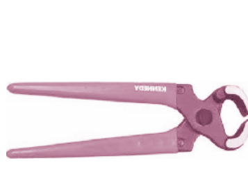
▲ รูปที่ 21 ครีมปากนกแก้ว

คีมปากนกแก้ว เป็นคีมอีกชนิดหนึ่งเช่นกัน มีลักษณะปากโค้งเข้าหากัน ใช้สำหรับหยิบจับ หรือตัดวัสดุที่ต้องการ คีมปากนกแก้วนี้ลักษณะปากจะค่อนข้างมีเอกลักษณ์ ดูโค้งๆ คล้ายปากของนกแก้ว