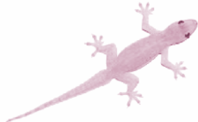
▲ รูปที่ 20 จิ้งจก

คีมปากนกแก้ว เป็นคีมอีกชนิดหนึ่งเช่นกัน มีลักษณะปากโค้งเข้าหากัน ใช้สำหรับหยิบจับ หรือตัดวัสดุที่ต้องการ คีมปากนกแก้วนี้ลักษณะปากจะค่อนข้างมีเอกลักษณ์ ดูโค้งๆ คล้ายปากของนกแก้ว