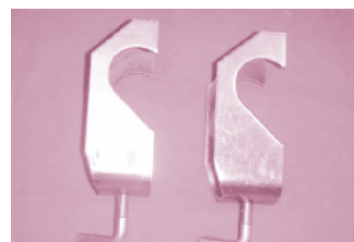
▲ รูปที่ 15 มือลิง

เมื่อพิจารณาจากรูปร่างของเจ้ามือลิง ส่วนตัวผมไม่แปลกใจเลยว่าทำไมจึงมีชื่อเรียกเช่นนั้น เพราะคล้ายๆ กับมือลิงที่ใช้ห้อยโหนอยู่จริงๆ จนรู้สึกชื่นชมคนที่ตั้งชื่อเรียกอุปกรณ์นี้จริงๆ ว่าคิดได้อย่างไร