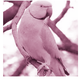
▲ รูปที่ 22 นกแก้ว

เขาควาง ผมคงไม่ได้หมายถึงสัญลักษณ์วงศาราบาวของช่างที่เป็นสาวรวงคนตรังนั้นนะครับ อันนั้นคงจะไปกันน้ำซุงไปสักนิด เขาควางที่ผมหมายถึงนี้ไม่เพียงแต่จะพบได้ในโครงการก่อสร้างแต่จะอยู่ใกล้ตัวของผู้อาศัยในบ้านโดยทั่วไปด้วยเนื่องจากเป็นอุปกรณ์ประกอบบ้านประตูตัวหนึ่ง