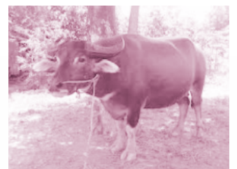
▲ รูปที่ 24 ควาง

เป็นอย่างไรบ้างครับ สัตว์ต่างๆ ในโครงการก่อสร้างที่ผมนำมาแนะนำให้รู้จัก น่ารักไหม!!