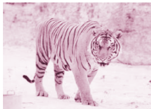
▲ รูปที่ 14 เสือ

เหล็กเข้าด้วยกันเช่นเดียวกัน ลักษณะจะเป็นตะขอเหล็กและมีแป้นตัวยึดรัดอยู่ด้านล่างมีลักษณะเป็นแป้นยึดติดกับด้ามตีเกลียวสามารถหมุนเลื่อนแป้นนี้ขึ้นลงได้