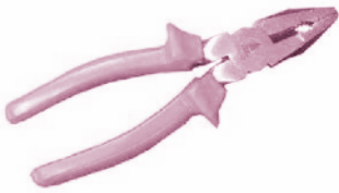
▲ รูปที่ 19 ครีมปากจิ้งจก

คีมปากจิ้งจก เป็นคีมชนิดหนึ่งที่มีลักษณะหัวปลายเรียวยาวประมาณปากของจิ้งจกเลยครับ สำหรับใช้งานหยิบจับ หรือตัดลวดก็ได้ ในกรณีที่ขนาดของวัสดุมีขนาดเล็กคีมจะเป็นอุปกรณ์ที่ช่วยในการทำงานได้มาก ที่เรียกว่าปากจิ้งจกเป็นเพราะสัดส่วนของความเรียวยาวของปากคีมใกล้เคียงกับปากของจิ้งจก