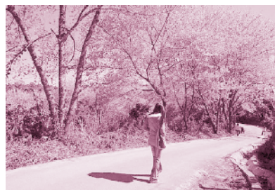
ต้นนางพญาเสือโคร่ง