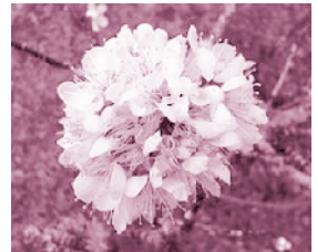
นางพญาเสือโคร่งดอกสีขาว ณ ขุนช่างเคี่ยน