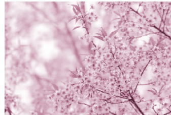
นางพญาเสือโคร่งดอกสีชมพู ณ ขุนช่างเคี่ยน