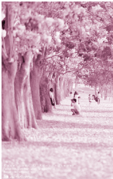
ชมพูพันธุ์ทิพย์ ณ มหาวิทยาลัยเกษตรศาสตร์ วิทยาเขตกำแพงแสน

สถานที่ที่แต่ละคนได้พบเห็น ทำให้ผู้เขียนถึงบางอ้อและอุทาน “อ้อ” ไปยาวๆ ว่า “อ้อออออ ต้นชมพูพันธุ์ทิพย์นี่เอง” เมื่อค้นพบคำตอบ ตัวผู้เขียนเองก็ยิ่งแปลกใจไม่หาย เพราะดูยังไง ก็ไม่เคยรู้สึกว่ามันเหมือนดอกซากุระได้ แต่ก็เพราะเรื่องราวในวันนั้นที่ทำให้ผู้เขียนได้ความรู้ใหม่ที่ว่าชาวญี่ปุ่นมองว่าต้นชมพูพันธุ์ทิพย์ที่มีดอกสีชมพูระเรื่อ่นั้นคล้ายกันกับดอกซากุระที่บ้านเขา และก็แปลกมากที่ไม่เฉพาะนักเรียนห้องนั้นที่ถามคำถามนั้นกับผู้เขียน เพราะหลังจากนั้นผู้เขียนก็ถูกถามคำถามเดียวกันนี้เรื่อยๆ จากผู้ถามชาวญี่ปุ่นไม่ซ้ำหน้า ทำให้รู้ว่าชาวญี่ปุ่นในย่านสุขุมวิทขนานนามให้ต้นชมพูพันธุ์ทิพย์ว่า “ซากุระเมืองไทย” ตรงกันจริงๆ