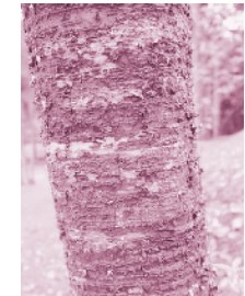
ลายของลำต้นซึ่งเป็นที่มาของชื่อนางพญาเสือโคร่ง