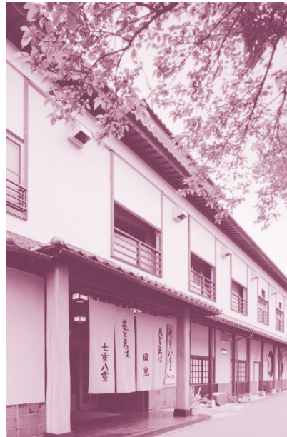
เรียวคังญี่ปุ่นที่กำลังได้รับความนิยมมากขึ้นจากคนไทยในปัจจุบัน

ตามภาคต่างๆ ของประเทศญี่ปุ่น ซึ่งได้มีการจัดอันดับต่อไปนี้