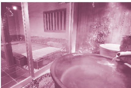
เรียวคังแบบญี่ปุ่นแท้ดั้งเดิม

นอกจากนี้ออนเซนจะมีอยู่ทั่วประเทศ และได้มีการพัฒนาให้เป็นแหล่งท่องเที่ยว โดยจะมีที่พักค้างแรมซึ่งส่วนใหญ่จะเป็นโรงแรมแบบญี่ปุ่นที่เรียกว่า เรียวคัง (Ryokan) และในโรงแรมเหล่านี้ก็จะจัดห้องพักแบบญี่ปุ่นดั้งเดิม พร้อมทั้งการบริการในแบบญี่ปุ่นที่น่าประทับใจ และนี่เองก็น่าจะเป็นสิ่งที่ดึงดูดนักท่องเที่ยวทั้งชาวญี่ปุ่นและชาวต่างชาติให้เดินทางไปพักผอนกัน