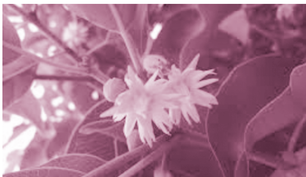
ดอกพิกุล

ดอกกระดังงา เป็นดอกไม้ที่มีชื่ออันเป็นมงคล เนื่องจากมีคำว่า "ดัง" อยู่ในชื่อ คนไทยจึงเชื่อว่าหากปลูกกระดังงาไว้ในบริเวณบ้าน จะช่วยให้สมาชิกในครอบครัว รวมถึงวงศ์ตระกูลมีความเจริญ