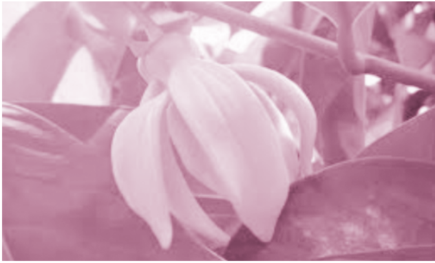
ดอกกระดังงา

ก่อนอื่นขอกล่าวถึงที่มาสักเล็กน้อยว่า คนไทยในอดีตเชื่อว่า ต้นไม้และดอกไม้บางประเภทที่ได้ชื่อว่าต้นไม้มงคลและดอกไม้มงคลนั้นมีพลังพิเศษบางอย่างที่สามารถทำให้ผู้ปลูกหรือผู้คนที่อาศัยอยู่ด้วยมีความเจริญรุ่งเรืองในชีวิต ดังตัวอย่างเช่น ดอกบัวซึ่งเป็นดอกไม้มงคลในทางพุทธศาสนา กระดังงาและบานไม่รู้โรยซึ่งเป็นดอกไม้มงคลนาม พิกุลซึ่งเชื่อกันมาแต่โบราณกาลว่าเป็นต้นไม้ศักดิ์สิทธิ์