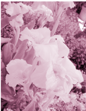
ดอกพุทธรักษา

วันพ่อแห่งชาติ ตรงกับวันที่ 5 ธันวาคมของทุกปี เป็นวันเฉลิมพระชนมพรรษาพระบาทสมเด็จพระปรมินทรมหาภูมิพลอดุลยเดช พ่อหลวงของหมู่พสกนิกรชาวไทย วันพ่อแห่งชาติจัดขึ้นครั้งแรกเมื่อวันที่ 5 ธันวาคม พ.ศ.2523 โดยคุณหญิงเนื้อทิพย์ เสรมรสดี ผู้ซึ่งดำรงตำแหน่งนายกสมาคมผู้อาสาสมัครและช่วยการศึกษาในขณะนั้น เหตุผลที่มีการจัดตั้งวันพ่อแห่งชาติขึ้นมานั้น เนื่องจากพ่อเป็นบุคคลผู้มีพระคุณและมีบทบาทสำคัญต่อครอบครัวและสังคม ที่ผู้เป็นลูกจะเคารพเทิดทูนและตอบแทนพระคุณด้วยความกตัญญูและสังคมก็ควรยกย่องให้เกียรติรำลึกถึงผู้เป็นพ่อ จึงถือเอาวันที่ 5 ธันวาคม ของทุกปี ซึ่งเป็นวันเฉลิมพระชนมพรรษาพระบาทสมเด็จพระเจ้าอยู่หัวภูมิพลอดุลยเดชเป็นวันพ่อแห่งชาติ นับเป็นโอกาสอันดีให้ลูกได้แสดงความกตัญญูต่อบิดต่อพ่อ ในขณะที่เดียวกันผู้เป็นพ่อก็จะได้สำนึกถึงหน้าที่และความรับผิดชอบของตน